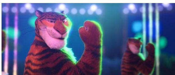
Figure 3. Zootopia 图3.《疯狂动物城》 ③