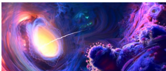
Figure 2. Big Hero 6 图2.《超能陆战队》 ②

许多其他动画电影也使用粒子系统技术来呈现各种特效。例如,《超能陆战队》中使用了粒子系统来模拟光线和烟雾等效果,营造出一种梦幻般的氛围,见图2。在《疯狂动物城》中,粒子系统被用来模拟动物皮毛的粗糙质地和运动时的毛发动态,以及城市中的各种自然现象如雨、雪等,见图3。另外,《寻梦环游记》中使用了粒子系统来模拟灵魂世界的奇幻景象,如万花筒般的色彩和光影变化。这些例子都展示了粒子系统技术在动画电影制作中的广泛应用和重要性,见图4。