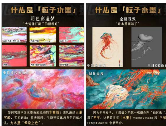
Figure 1. Definition of particle ink

粒子水墨技术是一种将中国传统文化元素与现代数字技术相结合的创新技术,是电影《深海》中应用的重要组成部分。粒子水墨技术最早起源于中国传统绘画中的水墨画技法,随着科技的进步,逐渐应用到电影制作领域[1]。这项技术利用计算机图形学和特效技术,通过模拟水墨画的笔触和纹理,创造出一种独特而富有艺术感的视觉效果。在电影《深海》中,粒子水墨技术被巧妙地运用,为观众呈现出深海中的神秘与壮美,见图1。通过粒子的运动和变化,电影创造了一种梦幻般的氛围,使观众沉浸其中[2]。通过研究粒子水墨技术的历史与发展,可以更好地理解其在电影《深海》中的应用,进一步提升电影的视觉体验。