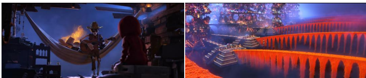
Figure 4. Coco 图4.《寻梦环游记》 ④