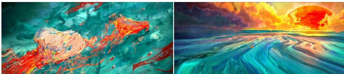
Figure 5. Particle visual effect 图 5. 粒子视觉效果®

影片一反对深海的“幽暗”认知, 而是以融合上百种色彩的水墨国画作为美术概念, 前所未见的视觉奇观更令网友直呼“惊艳”[7]。几十亿的三维粒子, 堆叠出了让人着迷的色彩, 这些粒子由水母、蝠鲼、鲸鱼和漩涡鱼群组成, 它们幻化成了漫天的云霓。数亿的粒子如瀑布般倾泻而下, 渲染出了一幅壮丽的海天画卷, 见图 5。《深海》中如梦如幻的视觉效果给前往电影院的观众留下了深刻的印象。田晓鹏曾经看到一幅画, 让他产生了想呈现一个不一样的大海的灵感。最终, 飘逸灵动的中国水墨成为这部电影的不二之选。