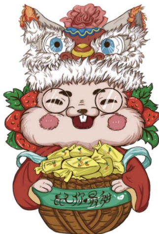
Figure 4. Zodiac rat design 图 4. 生肖鼠设计图

将所得的设计元素进行适当的变化延展, 如虎头帽延伸舞狮帽, 丰富设计元素, 如图 4 在“老鼠嫁女”的民间故事中延展出的形象, 人们会炒芝麻糖作为老鼠的喜糖, 将生肖鼠与盛满糖果的竹编器皿结合, 头戴舞狮帽突出嫁娶的喜庆气氛, 从而创作出新的生肖形象。对于其传播方式上以受众感受为主, 通过 NFT 技术进行线上的快速传播, 让生肖形象与音乐、视频等相结合从而在大众视线中脱颖而出。在有一定的受众基础上, 可以采用线下传播的方式, 打造文化全产业链, 将生肖形象运用到文创、包装、饰品之中, 从“互联网思维 + 科技化 + 设计活化 + 深度体验”的理念展现生肖文化的经济价值、艺术价值以及社会价值, 形成线上宣传销售与线下传递转化为物质消费的梦幻联动, 从而面向新一代的消费者。