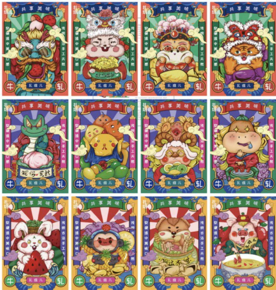
Figure 5. Design of bull roll candy for the twelve zodiac signs

始重新界定原有的商业模式,使传统产业借助社群、数字化平台、多元场景融合及跨界联合等商业模式,对文化元素重新整合、策划、包装,通过创意设计来提高 IP 的文化辨识度和市场认同度,从而推动经济增长,激发消费活力[4]。如图 5,在形成生肖 IP 在设计的基础上赋能牛轧糖产业,将生肖 IP 与企业特征相结合,为市场经济赋能。