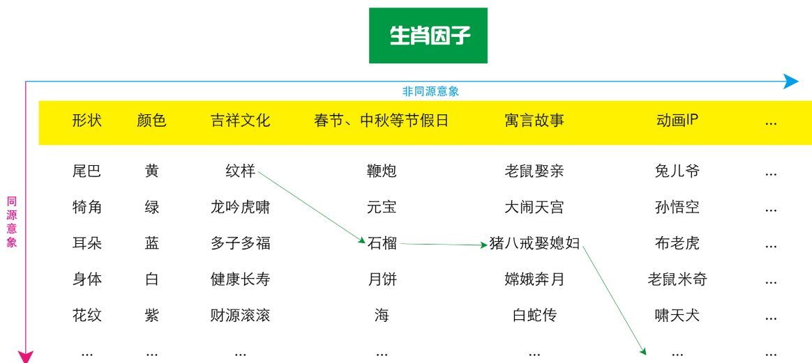
Figure 3. Diagram of image recombination

通过对生肖因子意象的收集与分析, 将具有象征性和代表性的视觉图像与文化语义的意象特征进行打散与重构, 用这些“基因”相互交叉来搭建用户模型库, 包括外观、个性、特质、色彩等视觉图像与联想到的文化基因符号进行提取与转化, 强化每一个生肖动物的原型表达, 由此组成一个独一无二的生肖特征, 获取设计参照与指引, 会产生很多的不同可能性, 能有效提升大众对后续 NFT 艺术喜爱程度, 如图 3。