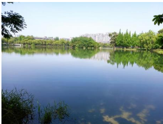
Figure 2. Water environment photo of Xihua University

根据总体调研情况来看,西华大学生态环境、水体环境总体较好,存在鱼、黑天鹅、鸭子、白鹭等多种生物,水中污染物的数量较少,污染程度较轻(图2)。具体来看,文渊湖湖水清澈,几乎没有肉眼可见的污染物;天籁湖存在少量固体污染物,包括生活垃圾和投喂天鹅的食物等;怀诚湖存在少量死鱼,可能是白鹭等鸟类的食物残渣;沱江河支流存在少量塑料污染物、厨余油污、建筑废料;校史馆外池塘偶尔存在实验室排放的污水和大量藻类。相关水污染总结情况见表1。