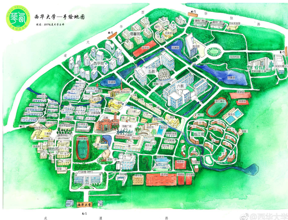
Figure 1. Water system distribution of Xihua University

西华大学校本部水源较多, 主要水源有从外流进的沱江河支流、艺术大楼外的天籁湖、图书馆后面的文渊湖、西华苑外的怀诚湖及四教、校史馆外面的大小池塘(如图 1 所示)。穿西华而过的沱江河, 是成都上游至关重要的水源。