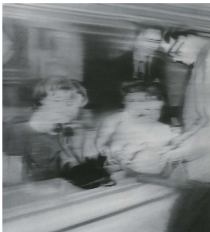
Figure 2. (German) Gerhard Richter, Visitor Center , painted in 1996 2 图 2. (德)格哈德·里希特《游客中心》1996 年作 2

这种自主的随意的绘画方式也有着一定的记录性[5], 但与摄影还是有着本质区别, 观者可以察觉到格哈德·里希特的照片绘画将图像描绘的更加真实、深刻。