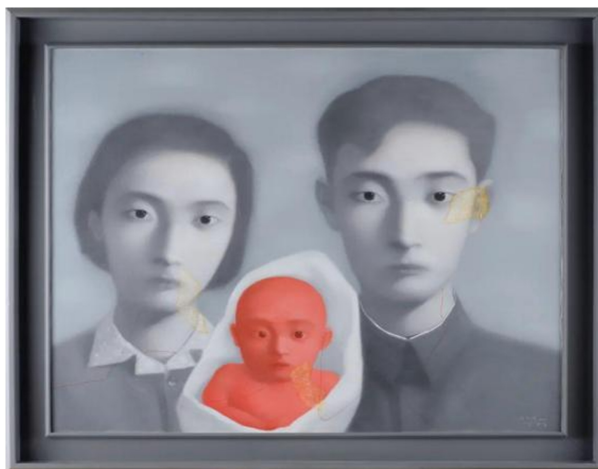
Figure 1. One of the Big Family series by Xiaogang Zhang, painted in 2001 1

的艺术创作。与此同时, 这种科学的创作形式也更有利于观者对作品的解读与赏析。换言之, 对创作者来说在油画创作过程中对图像的合理引用, 可以提高对图像的真实性的捕捉和主观情感的融入。同时使观赏者可以更好地与艺术作品产生共鸣。