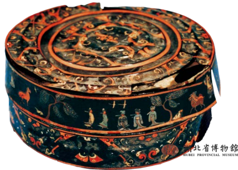
Figure 1. Painted figures, carriages and boxes from Chu Tombs in Jingmen, Hubei Province