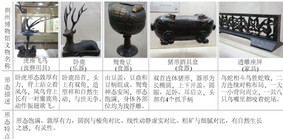
Figure 3. Morphological characteristics of Chu style Lacquer ware 图 3. 楚式漆器形态特点

竹、藤、革、皮等材质都成为楚国漆器胎体的重要选择，它们在生活、装饰和陪葬等等各种领域绽放着夺目的光彩(图 3)。