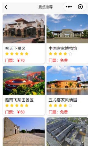
Figure 5. Tourism design