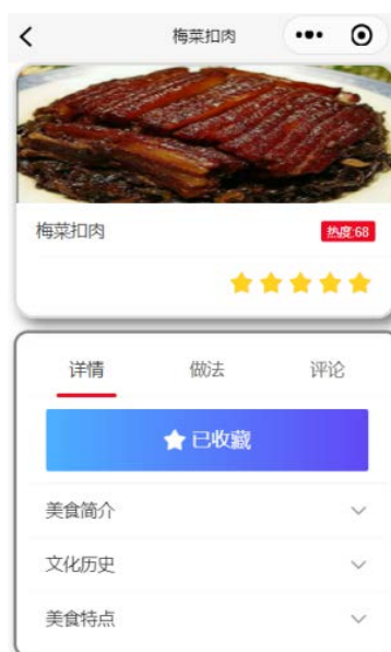
Figure 4. Gourmet food design