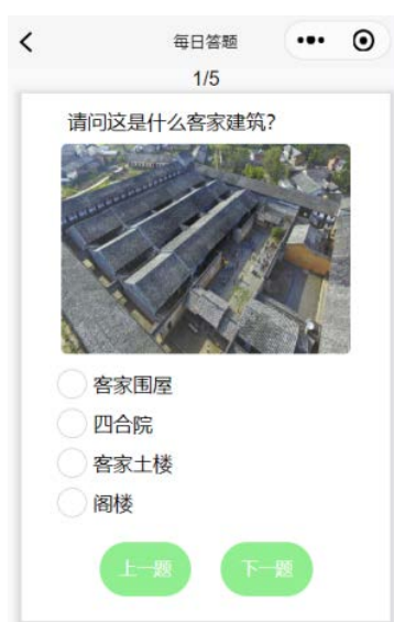
Figure 3. Daily quiz

化, 同时允许根据关键字搜索相应的非遗项目, 点击列表进入详情页, 该详情页除了图文并茂展示该非遗文化, 还允许收藏、分享至微信和点赞。每日问答功能需要登录后方可正常使用, 如果没有登入则引导至个人 Tab 页进行登录, 然后进行单选答题, 界面如图 3 所示。客家美食模块采用卡片式列表方式展示各个美食, 卡片信息包括美食图片、名称、热度和推荐度。美食详情页如图 4 所示, 下半部分采用 Tab 形式展示美食的详情、做法和当前对该道美食的评价, 其中详情部分采用手风琴式的折叠面板分别描述美食简介、历史渊源和美食特点, 做法部分则是该道美食的教学视频。景点推荐模块以图 5 形式展示各个景点, 景点详情页有该景点的精美图集、推荐指数、景点所在位置、开放时间和历史说明, 最后也允许用户对该景点评论和查看其它用户的评论。