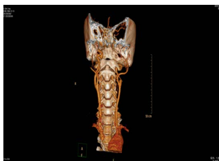
Figure 3. Carotid CTA orthometry 图 3. 颈动脉 CTA 正位