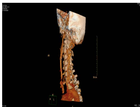
Figure 4. Carotid CTA lateral 图 4. 颈动脉 CTA 侧位