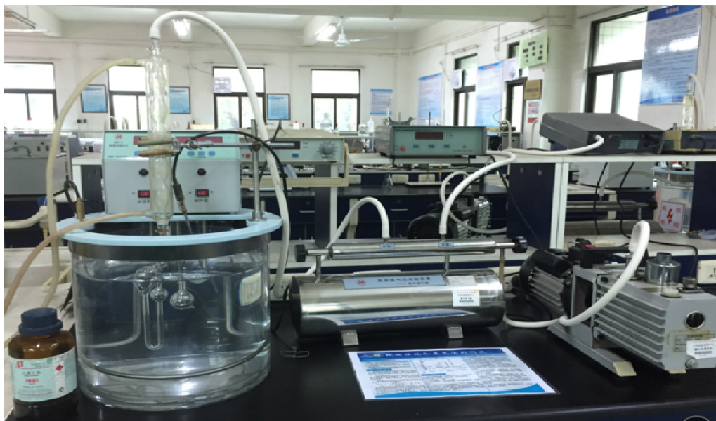
Figure 2. Bilingual physical chemistry experiment video integrating ideological and political elements

制作热力学实验、电化学实验、动力学实验和表面化学实验等物理化学实验录频。每个实验前都有实验室安全小提示，见图2。