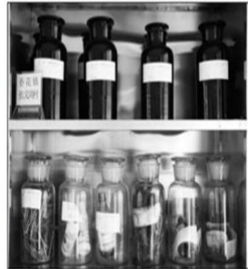
昨日,朝阳陶粒水样自动检测站内的土壤样本。

截止记者发稿前,肇事司机戴春明还未去医院看望伤者,并向伤者和家属表示歉意,目前事故还没有得到解决。