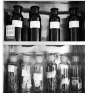
昨日,朝阳陶粒水样自动检测站内的土壤样本。

截止记者发稿前,肇事司机戴春明还去医院看望伤者,并向伤者和家属表示歉意,目前事故还没有得到解决。