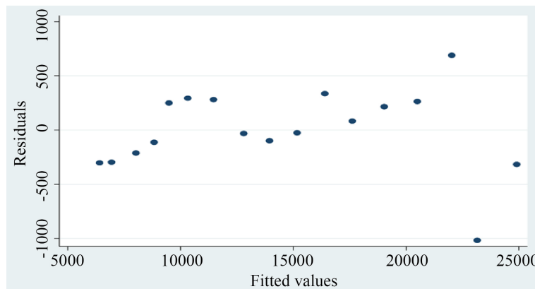
Figure 2. Scatter plot of residual and fitted values of disposable income of rural residents