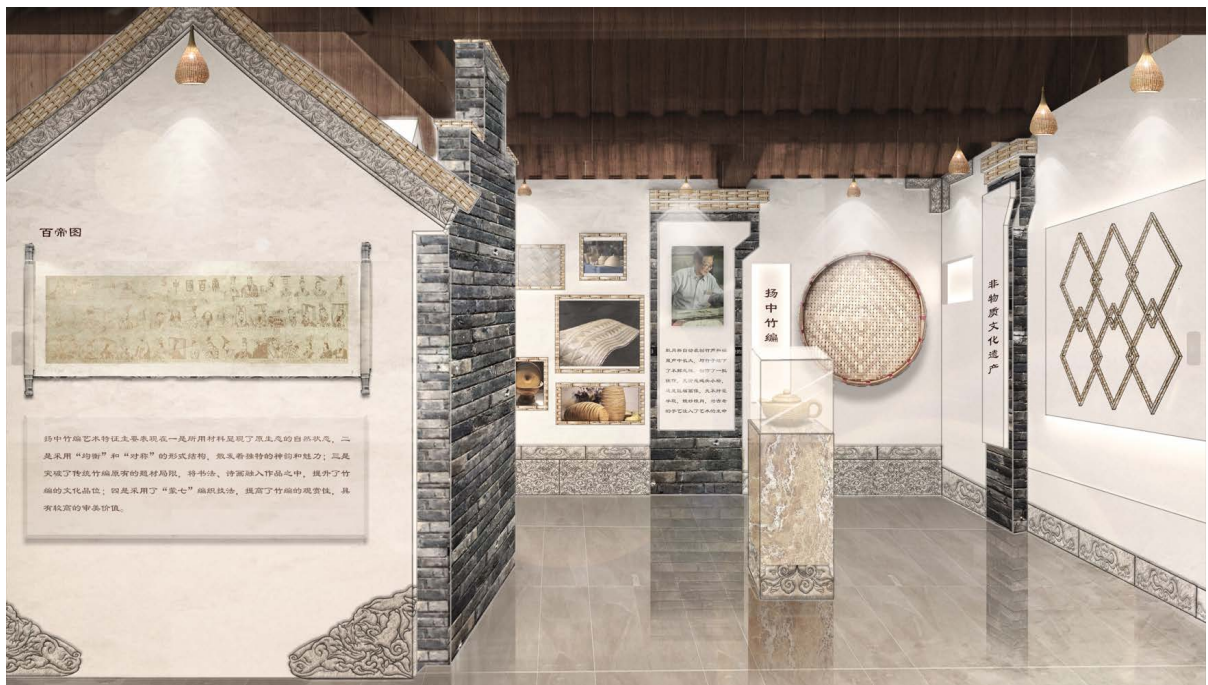
Figure 7. Bamboo weaving art bar 图 7. 竹编艺术吧