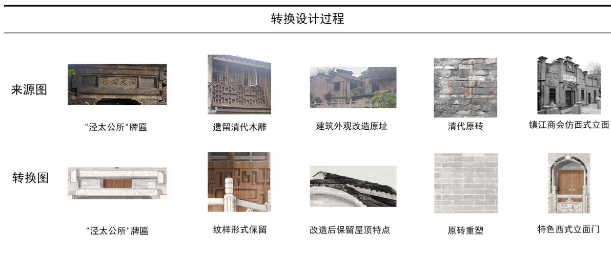
Figure 4. Schematic table of sources and conversions of architectural exterior elements