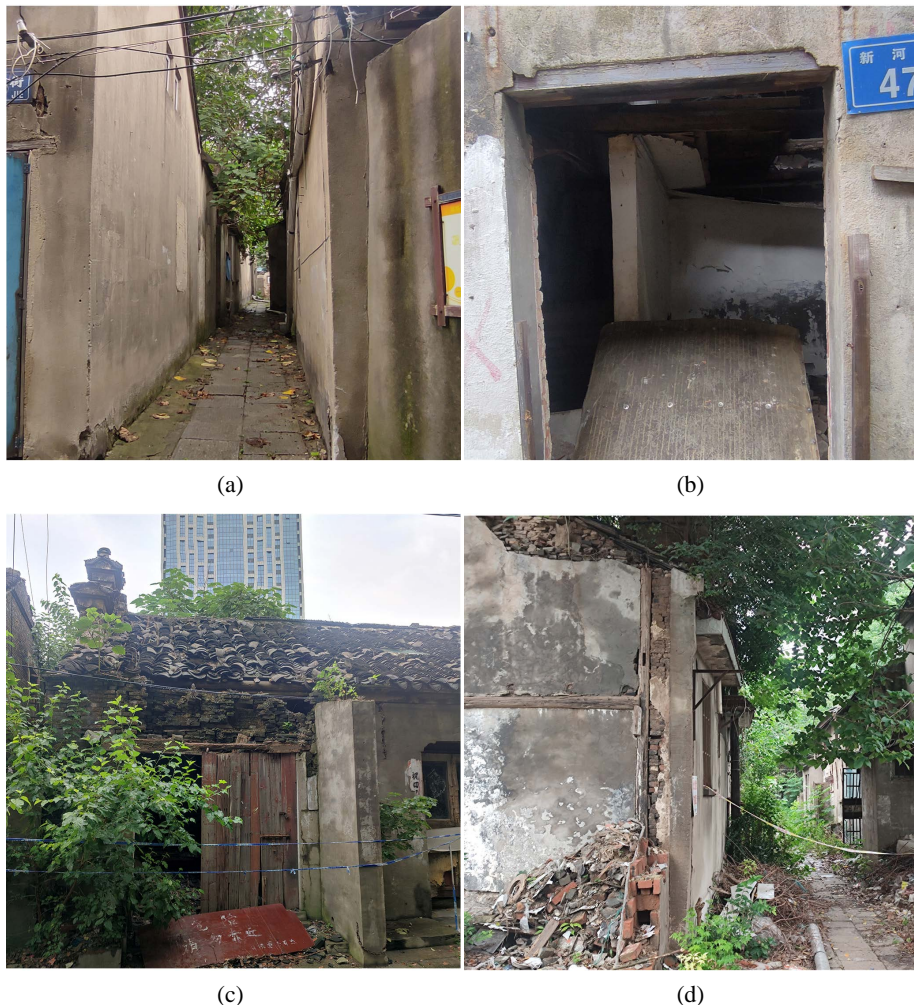
Figure 1. Photographed by the current situation of Xinhe Street 图 1. 新河街现状地域考察拍摄图

新河街当前已经拆迁，常年积累的问题也逐步显现出来，归纳起来有以下几点：1) 新河街内部交通不够通畅，内部街巷肌理由于杂物堆放以及建筑坍塌变得不够清晰。据钱鑫等《镇江新河街历史街区街巷空间调查研究》一文分析得出，原本新河街有一条主街，11 条小巷[5]。现今只有尹家巷，堂子巷可通行，其余小巷不可通行，且小巷空间过于狭隘，无大型公共空间(见图 1(a))，不利于旅游区域的人员流动。2) 室内方面，同样面临着需要改造的方面。新河街多数民居层楼高不过 2.8 米，给人一种压抑的空间环境(见图 1(b))，且室内功能空间也与目前多元化的功能空间需求不匹配。3) 在建筑外观方面，该区域建