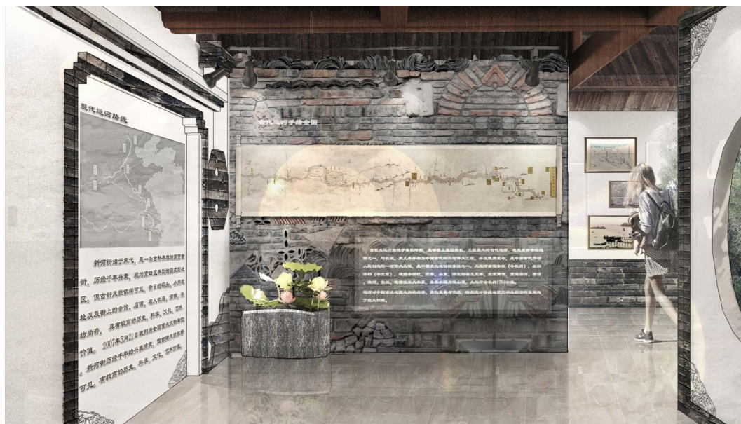
Figure 8. New river street canal culture exhibition hall 图 8. 新河街运河文化展示馆