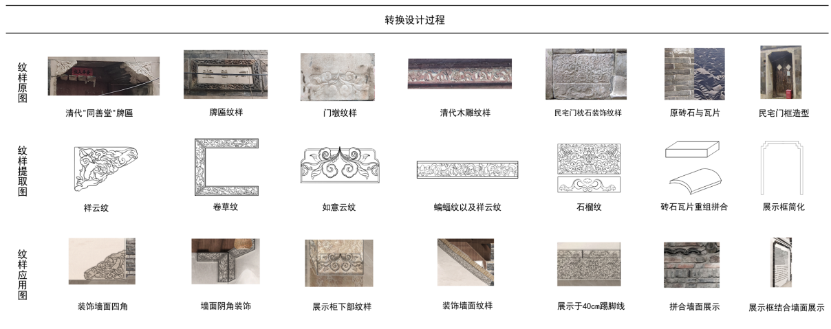
Figure 6. Conversion and application of interior renovation design elements 图 6. 室内改造设计元素转换以及运用图

云纹寓意如意顺利，石榴纹寓意多子多福。具体设计中牌坊纹样可以通过其边角方正的特征，装饰室内墙面的四角；牌匾纹样可以截取左上角四分之一处并进行对称变换，用于墙面阴角装饰；门墩纹样可以用于展示柜下部的雕刻装饰设计；清代木雕的二方连续蝙蝠纹，可以横向应用于不规则墙面装饰；清代门枕石的纹样可拼合在一起，与室内高 40 cm 的踢脚线结合，创造出独特的设计氛围效果。此外，旧材料如砖块和瓦片可以重组拼合，作为室内装饰墙面的元素，民宅门框的造型可以提取并重新设计，用于室内的展示框(设计过程见图 6)。运河文化水系图和扬中竹编将展示其中，让人们感受到浓厚的镇江扬中竹编和运河文化氛围。这样的设计创造了一个独特的氛围和体验场所的同时，促进了地域文化的传承和发展(最终室内效果图见图 7、图 8)。