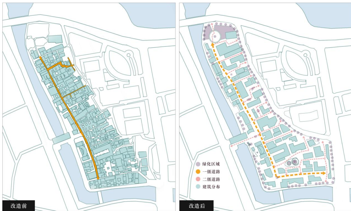
Figure 2. Comparison diagram of space layout planning 图 2. 空间布局规划对比图

在整体街区空间维度上，新河街整体街区需要通过重新组织空间布局，优化当前街区通达性。当前现状我们可知新河街整体空间杂乱，只有主路与两条小巷可通行，将在整体街区的道路上，要以增强社区的活力和社交互动规划并设计更加宽敞的步行道路，进行道路整改，理顺整体交通流线，规范通行，使整个新河街充满着秩序与空间感，整体流线确保街区流线畅通和人流的合理分布。道路整改过程中，可拆除部分历史价值不高的危房，并对历史价值高的古建筑进行单体改造，确保拓宽道路的同时，尽可能的保护古建筑。在绿色可持续性景观维度上，曾经杂乱的植被已无参考价值，整体绿化需要重新再设计，空间通达性高处设置景观节点，给空间绿地增强围合感，提高街区的绿化性、可访问性和导向性(空间布局对比见图 2)。