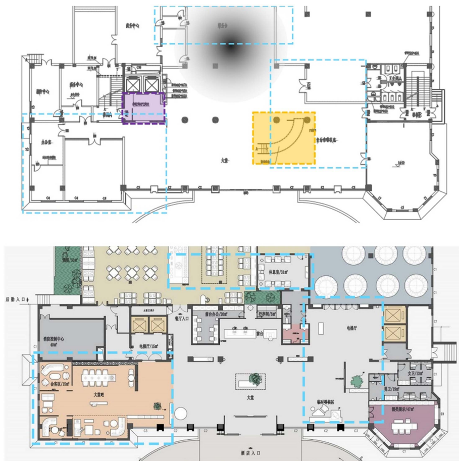
Figure 7. Comparison of floor plans before and after the lobby renovation

改造时对大堂原有功能空间重新梳理，大堂整体面积缩小，但空间更舒展流畅，如图7、图8。首先，将旋转步梯移除，使得空间更为开阔，并在大堂东侧设置两台新电梯，分担会议餐饮客流，使其与客房客流分开，优化使用体验，同时也更有利于酒店的安全管理。其次，将大堂深处的服务台外移至空间开阔处，采光也更好，客人在服务台办理业务时，不会感觉压抑；原本放置服务台的位置与附楼部分结合成方正的矩形空间，置入全日制自助餐功能，完善酒店的餐饮服务内容。另外，整合大堂周边空间，置入大堂吧、商务会客区、等候区，和外租商铺等功能，提高了大堂的使用性，提升住客体验感。