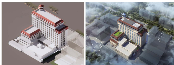
Figure 6. Comparison of the transformation in the northwest corner 图 6. 改造前后西北角鸟瞰图对比 ②