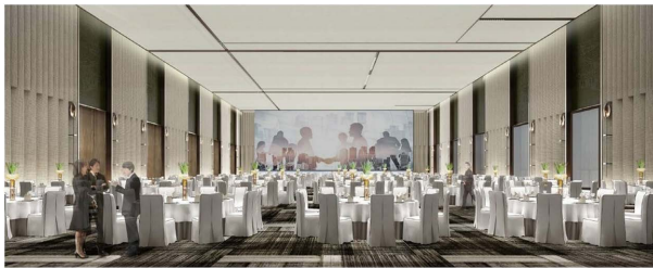
Figure 13. Renderings of the remodeled ballroom 图 13. 改造后宴会厅效果图 ②