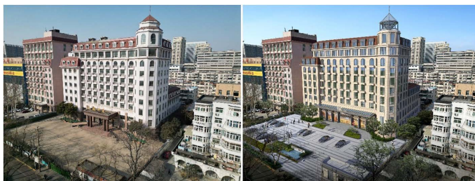
Figure 1. Comparison of the transformation in the northeast corner

合理利用前院广场空间在前院设置停车位，并将原有的封闭围墙打开，设置景观边界作为城市奖励空间，使得场地与城市的关系更为融合、有弹性，如图1所示。