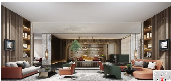
Figure 11. Renderings of the lobby bar after the renovation

项目酒店的餐饮是优势项目，因此在改造中，需要提高餐饮设施配置及品质，以更好地发挥其优势，并间接拉动会议及住宿需求。改造前，酒店配有三个餐饮设施，分别为位于大堂的茶室、全日制餐厅和中餐厅(含包房)，改造重点在打造丰富多样的餐饮功能空间，提升就餐环境及体验上。一层在大堂空间重新整合后，用功能更全面的大堂吧替换了原有的茶室，如图 11，在主楼和附楼之间增加了全日制自助餐厅，见图 12，并与宴会厅(图 13)相连，丰富餐饮服务形式，合理分配了大堂原有空间。