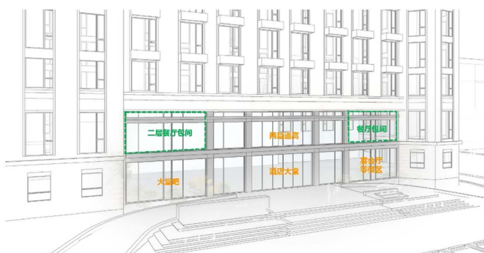
Figure 4. The entrance is re-clad with a glass curtain wall 图 4. 入口重新覆盖玻璃幕墙 ②

造型，让人们从远处就能辨识出酒店的位置，如图 6 所示。此外，将八层和三层的屋顶平台进行景观布置，形成一个立体的多层次屋顶花园。