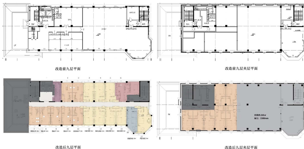
Figure 9. Floor plan before and after room renovation 图 9. 亮点客房九层及夹层改造前后平面图 ②

项目酒店的房间面积相对于品质较好的同档次酒店相比较小，因主楼结构，部分套房的转换受到限制。在改造时，于原有客房数量的基础上拆分套房以增加客房数量，调整客房的整体户型配比，增加产品溢价。改造后酒店客房集中分布在宾馆的 4 至 9 层；局部调整客房布局，去除不再符合市场主流需求的三床房、四床房、五床房，房间尽量按大床房和标准间布置，保留套房，并新加入好莱坞房型和复式套件房型，为消费者提供更多选择，实现更广泛的多层次年龄段客源覆盖。房型升级方面，原有九层的宴会厅及包房拆除，作为客房楼层统一打造：由于九层视野较好，并且层高较高，有条件打造成复式格局房型，作为长包房、酒店公寓等特色房型打造，形成酒店的客房亮点，如图 9、图 10。