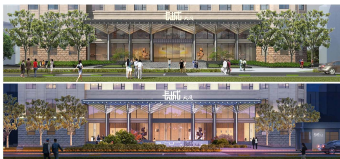
Figure 5. The effect of the entrance after the transformation 图 5. 改造后入口效果 ②