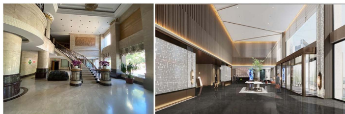
Figure 8. Comparison of lobby space before and after renovation 图 8. 改造前后大堂空间对比 ①