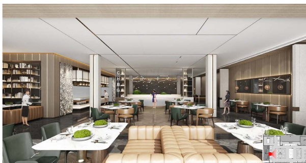
Figure 12. Renderings of the renovated all-day dining restaurant