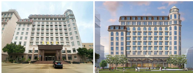
Figure 3. Comparison of the south facade before and after 图3. 改造前后南立面对比 ①

首先重新设计整合主楼南立面语言，让整体形象更统一，表现出端庄大方、简洁利落的建筑气质，将立面上部分老旧的特征明显的装饰去除，如山花柱式老虎窗和加长爱奥尼柱，保留老虎窗，用深灰色金属板包裹，重新造型，新材料的引入，可以为建筑增添新的生机与活力，新旧对比融合，产生对话关系；同时，新造型的老虎窗在抬头仰望时，有长城墙垛的韵律，与酒店的“长城”文化内涵相契合，如图3所示。