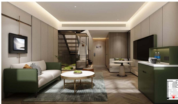
Figure 10. Renderings of the home loft room type