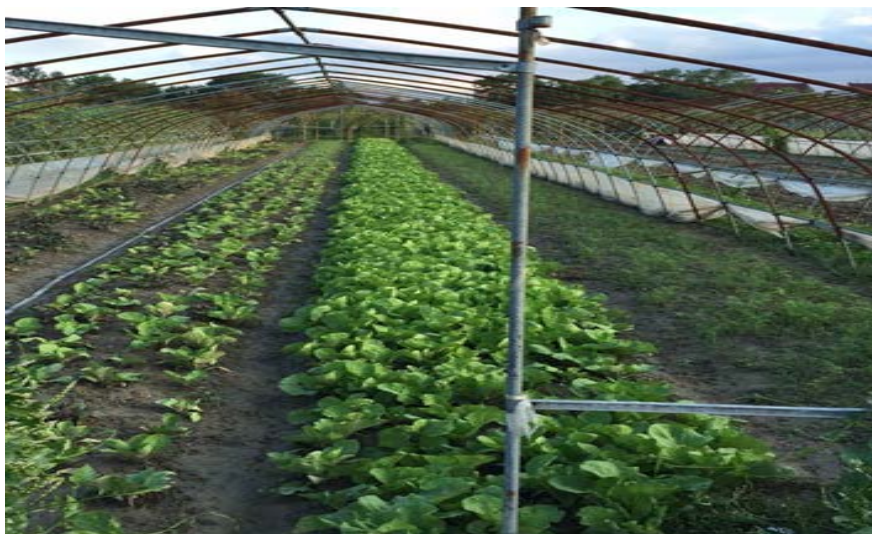
Figure 2. Comparison chart of vegetable growth in general soil (left side) and earthworm soil (right side)

失。蚯蚓土壤固化治理的同时投加各种草种，快速培养出绿色草坪的柔式护坡驳岸。高速公路边坡草坪覆盖率高，见图 3。坡体抗台风暴雨，耐冲刷，耐干旱，使雨季河水不浑浊。施工简单，工期短，能省略大部分水泥拱廓，成本低。大坡度斜面绿化，耐雨水冲刷，土壤不流失不垮塌，植被生长迅速，施工简单，效果显著持久[18][19]。⑦ 用于草坪和绿化带。⑧ 粪污治理和改善生态环境。