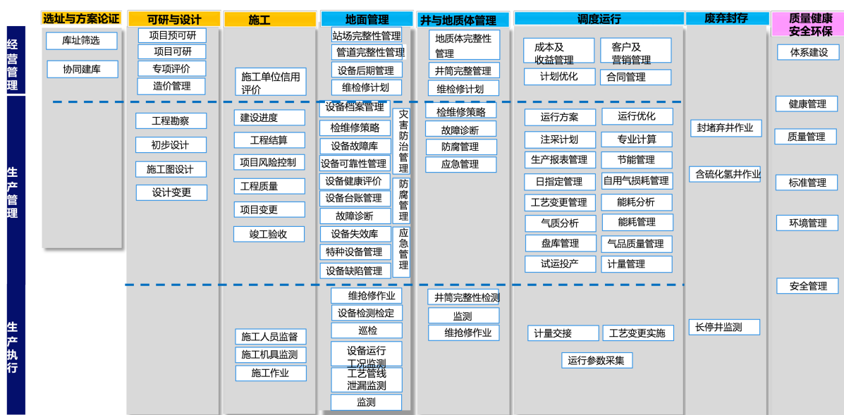
Figure 1. The business of gas storage

储气库主营业务覆盖工程建设、运营维护两阶段。工程建设阶段，包括项目规划选址与方案论证、可研与设计、施工与验收三方面；运营维护阶段包括库区管理、井与地质体管理、调度运行三方面。废弃封存主要对履行报废审批手续或批准核销后进行封堵弃井作业。质量安全管理贯穿工程建设、运营维护、废弃封存三个阶段，提供支持保障。其业务划分如图 1 所示。