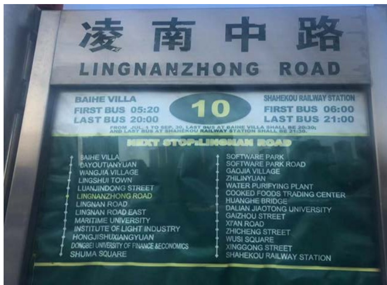
Figure 6. A bus stop sign in DMU 图 6. 校园内公交车牌

从“合作原则”的框架来看其语言本体：图 7 的标牌运用了四个四字词语，高度浓缩与概括，符合 Quantity 和 Quality 原则。四个回归并没有明确指出是哪四个回归，一是因为如果做过多解释，又要多加两块牌子，违背了语言标牌简洁省力原则；二是因为四个回归对于大连海事大学的师生而言并不陌生，四个回归是指教育部建设高水平本科教育和人才培养质量提出的“回归常识、回归本分、回归初心、回归梦想”四个回归要求。四个回归、以本为本传递出大连海事大学的办学理念，同舟共济、矢志一流则传递出大连海事大学力争一流的雄心壮志。篇幅虽短，内涵丰富，高度概括与总结大连海事大学的目标与理念，符合 Relation 原则。整个牌子运用蓝色为底色，字体为白色，干净整洁，便于识别。该标牌位于大连海事大学内部，面向广大师生，所用词汇皆为常见词。且标牌上方为大连海事大学的校徽，下方为大连海事大学内部一座教学楼的模型，对于大连海事大学的师生而言，简洁明了。同一块标牌上，既有标语，又有大连海事大学的校徽以及建筑物，增添了艺术气息，符合 Manner 原则。