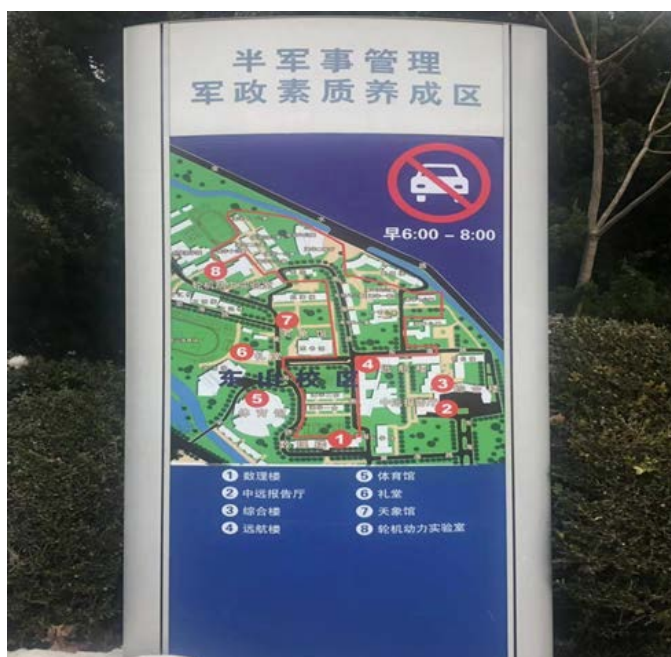
Figure 8. A map about DMU

从“合作原则”的框架来看其语言本体：图8的标牌禁止车辆通行的标志用了红色，十分醒目，简单的禁止符号在中国随处可见，要比禁止通行四个字来的简洁，而且图像带来的震撼力要远远大于文字，符合 Manner 原则。标牌第一行为半军事管理，凸显该地区的性质，不是全军事管理，而是半军事。第二行则凸显该地区的功能，养成军政素质。每一个字都有其特定含义，符合 Quantity 原则。禁止车辆通行的标志老少皆懂，不会造成误解。另外标牌中的字相对来说比较简单，对于接受过义务教育的人而言，认识并且理解这些字毫无困难，符合 Quality 原则。军事、军政这两个词传递了一个信息：该地区与军事有关。半军事管理区则突出该军事管理区的不同之处，不是全部军事化管理；军政素质则表明来这里是要提高军政素质，不是其他方面的素质，符合 Relation 原则。