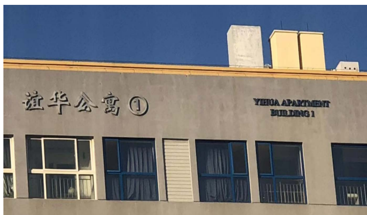
Figure 1. Yihua Apartment Building 图 1. 谊华留学生公寓

从“合作原则”的框架来看其语言本体：该图 1 的标牌分为中文和英文两个部分。左侧的中文“公寓”二字表明了这个区域的功能是该校师生住宿的区域，符合 Quantity 原则。“公寓”二字与一般的“宿舍”称呼略有不同，公寓的硬件设施往往比宿舍好一些，这体现这栋楼的住宿条件比其他的好。右侧的英文“YIHUA APARTMENT BUILDING”采用了“音译 + 直译”的翻译策略，这种翻译中国师生也能明白，方便外国人问路；若全部直译，即译为“FRIENDSHIP CHINA APARTMENT BUILDING”，外国留学生问路时会令中国师生感觉一头雾水，这种命名方式符合 Quality 原则。此外，该标牌位于楼层的顶部，字体较大，师生很容易能够辨识出建筑物的具体信息。“谊华公寓”中的“谊”字是友谊的意思，整体意思是与中国的友谊，从侧面表明了这栋楼的住宿群体是外国留学生，同时符合了 Relation 和 Manner 原则。