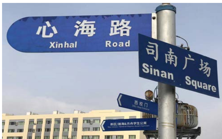
Figure 5. A guidepost in DMU 图 5. 大连海事大学路标

从“合作原则”的框架来看其语言本体：图 5 的标牌是一个路标指示牌，只有道路的中英文名称，再无其他，词句虽少，意思表达地十分到位，且蓝底白字，简单大方，符合 Quantity 原则。对于当代大学生而言，这几个汉字都十分简单，问路时也比较方便，其英文翻译也是采用了音译 + 直译，方便外国人问路，符合 Quality 原则。该路标指示牌位于学校司南广场附近的三叉路口，树立标牌有利于向过往学生提供道路信息，符合 Relation 原则。此外该路牌是中英文双语标牌，体现了大连海事大学的国际化办学水平，即不仅为国内学生提供信息，还为国际学生提供信息，也从侧面表明大连海事大学留学生较多，符合世界一流海事大学的办学标准。该指示牌是好几个指示牌叠加在一起摆放，其指向则代表了该标牌上的地方所在方位，便于不分方向的同学寻找目的地；另外，交叉排放路标，带来一种视觉上的享受，同时节省了空间，符合 Manner 原则。