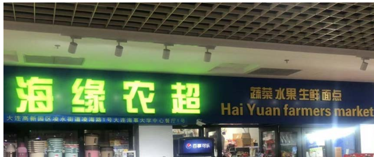
Figure 3. Hai Yuan farmers market 图3. 餐饮区超市

从“豪根理论”的角度来看其与周围环境的关系：“海缘农超”位于大连海事大学的中心食堂，该食堂的占地面积较大且餐饮品种丰富，来往师生较多。这个标牌所处的位置符合该地作为校园餐饮区的功能，与周围环境同属于一个生态，符合 Macro 和 Meso 原则。另外，“海缘农超”中的“缘”这个字在中国文化中含义丰富，比如缘分、姻缘，一般寄托着人们的美好希望，这个字很容易赢得来往师生的认同感，符合 Micro 原则。