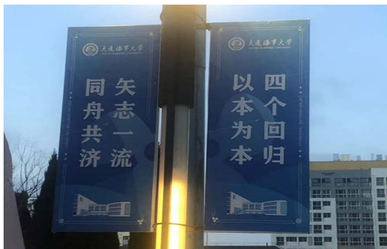
Figure 7. A bulletin board in DMU 图 7. 校园宣传栏

从“合作原则”的框架来看其语言本体：图 7 的标牌运用了四个四字词语，高度浓缩与概括，符合 Quantity 和 Quality 原则。四个回归并没有明确指出是哪四个回归，一是因为如果做过多解释，又要多加两块牌子，违背了语言标牌简洁省力原则；二是因为四个回归对于大连海事大学的师生而言并不陌生，四个回归是指教育部建设高水平本科教育和人才培养质量提出的“回归常识、回归本分、回归初心、回归梦想”四个回归要求。四个回归、以本为本传递出大连海事大学的办学理念，同舟共济、矢志一流则传递出大连海事大学力争一流的雄心壮志。篇幅虽短，内涵丰富，高度概括与总结大连海事大学的目标与理念，符合 Relation 原则。整个牌子运用蓝色为底色，字体为白色，干净整洁，便于识别。该标牌位于大连海事大学内部，面向广大师生，所用词汇皆为常见词。且标牌上方为大连海事大学的校徽，下方为大连海事大学内部一座教学楼的模型，对于大连海事大学的师生而言，简洁明了。同一块标牌上，既有标语，又有大连海事大学的校徽以及建筑物，增添了艺术气息，符合 Manner 原则。