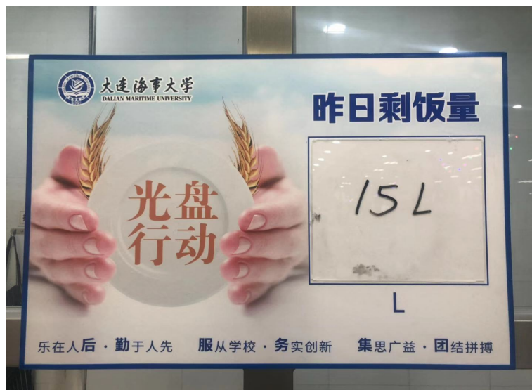
Figure 2. Tableware collection 图 2. 餐具回收处

量”则统计了昨天浪费食物的重量,这是一种实际的状态。Gunther Kress (2006)提出了“理想与现实范式”(Ideal-Real paradigm),即一个标识语分为假定的理想状态和现实的实际情况,该标牌符合 Gunther Kress 提出的设计原则[22]。标牌上面的字面向的是全体教职工,这些受众一般而言受教育程度较高,标牌上的语言比较简单,符合 Quality 原则。此外,李小飞(2020)通过一项实验表明,人们对于大字体、粗字体的整体认知度高于常规字体,该标牌下方连用 6 个成语发出了美好的号召,每个成语都有一个重点字加粗,重点显而易见[23];左侧的光盘行动四个字字体较大,颜色采用醒目的红色,给人一种警示,右侧的数字采用黑色马克笔书写,且每日更新,突出整块标牌的重点,而且符合 Manner 原则。