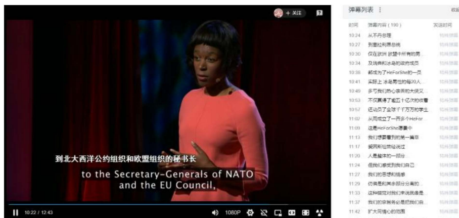
Figure 13. The real-time bullets are translating the subtitles for the video 图 13. 弹幕在为视频字幕翻译

上文讨论了弹幕群体之间的相互关系，可以总结出弹幕参与者主要寻求的是情感上的满足，而不是知识或认知的提升。由于弹幕创作是一种无偿的行为，因此即使是分享知识甚至是字幕型弹幕等长弹幕也是为了寻求情感上的回报。如下图 13：