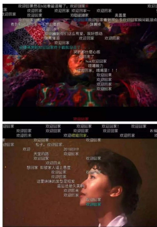
Figure 9. The real-time bullets are setting a warm mood 图 9. 弹幕在烘托温暖的气氛

在很多时候，弹幕之间构建关系并不是为了就当下的画面开展新话题，而是弹幕之间相互合作来为当下的视频画面烘托气氛，此时各弹幕之间就构建起了合作关系。如下图 9：