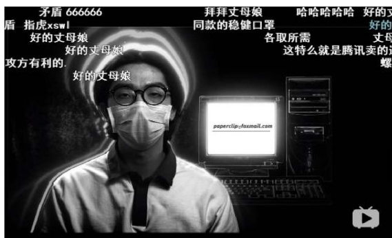
Figure 7. Screenshot of the “Paperclip Agency” video real-time bullets