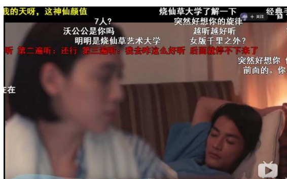
Figure 3. Screenshot of the MV main part

图 2 是来自 B 站一个电子竞技赛事盘点视频的片尾截图，在视频的片尾经常会出现“下次一定”的弹幕。“下次一定”是指“下次一定投币、点赞、关注”。“投币、点赞、关注”是 B 站设置的观众与视频创作者进行友好互动的功能，观众可以通过以上功能来表达对视频创作者的喜爱，而创作者能够通过“投币、点赞、关注”的数量来获得平台的奖励。因此在很多视频的片尾，视频创作者会用各种方式暗示或明示观众进行“投币、点赞、关注”，而观众则常常用“下次一定”或“下次也不一定”来进行调侃式的回应。