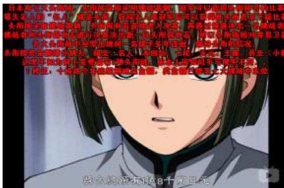
Figure 8. The real-time bullets are popularizing Go 图 8. 弹幕在科普围棋知识