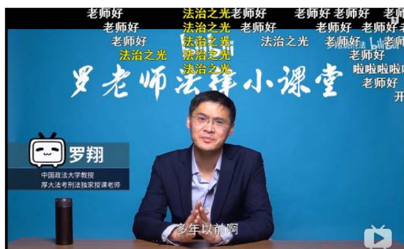
Figure 6. Screenshot of “Luo Xiang Speaks Criminal Law” video bullet screen