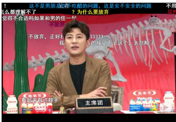
Figure 11. The real-time bullets are discussing the problem 图 11. 弹幕在讨论问题

在弹幕 1 发起临时话题时，出现了后面弹幕的反对，从而进一步展开了对女主角长相的讨论，此时这些弹幕就构建起了讨论关系。这是由弹幕引起的讨论，而有时，讨论是由视频本身引起的。如下图 11：