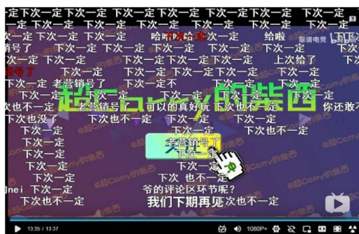
Figure 2. Screenshot from the end of the race inventory video 图 2. 赛事盘点视频结尾截图

图 1 是 B 站上周杰伦单曲《说好不哭》MV 开头的截图,在这类视频的片头常常会出现“再来亿次”“再来亿遍”的弹幕。“亿次”是“一次”的谐音替换,同时用“亿”替换“一”表示已经重复观看此视频很多很多次了,以此来表示对这个视频的喜欢。