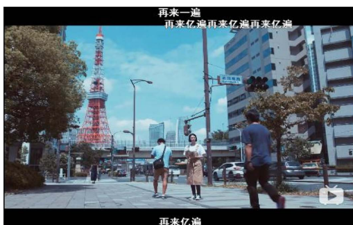
Figure 1. Screenshot of the beginning of the MV video 图 1. MV 视频开头截图 ①

context)与文化语境(cultural context)。因此,在弹幕语言中场景由社会环境(social environment)与即时环境(immediate environment)组成,社会环境是普遍的,而即时环境是特殊的。随着互联网的飞速发展,以互联网为大环境所产生的网络的语言已经广泛的流行与人们生活。网络语言是随着社交媒体的广泛使用,为了满足网民在网上交流时对效率或诙谐、幽默等特定需求而逐渐发展并形成的特定语言。弹幕作为网络背景下的网络语言应用场景之一,弹幕的用户同样有着同样的语言需求。除此之外,作家、游戏设计师 Marc Prensky (2001)曾提出“网络原住民”这一概念,指与互联网一起成长起来的这一代人。这些年轻人从出生起,他们的生活就与互联网时刻捆绑了起来,电影、音乐、游戏等绝大部分社交娱乐活动都是在互联网虚拟世界中进行。而中国的 90 后、00 后正是这样的“网络原住民”。互联网社交的急速发展使得现实中的社交变得困难,这一代人变得普遍感到孤独。同时,新时代下,年轻一代是标新立异与追求个性的一代,而互联网的发展为年轻人提供了充分展示自己的窗口。一边时常孤独需要归属感,同时又需要个性化的表达,这一群年轻群体与 B 站的核心用户高度一致(数据公司 Quest Mobile 在《移动互联网 2017 年 Q2 夏季报告》中公布了 24 岁及以下中国互联网用户喜爱的十大 APP 名单,其中 B 站位列榜首, B 站活跃用户数量超过 1.5 亿,其中 75% 的用户年龄小于 24 岁)。以上描述就是弹幕语言使用的普遍社会环境(social environment)。我们可以把每一个拥有弹幕功能的视频看作弹幕语言发生的地点,然后把整个视频大致分为片头、正片、片尾。这样按照时间把视频分成三段也符合大部分视频制作者的习惯。弹幕会随着视频片头、正片、片尾三个不同时段的变化而有所不同的。下面将举例进行细节分。