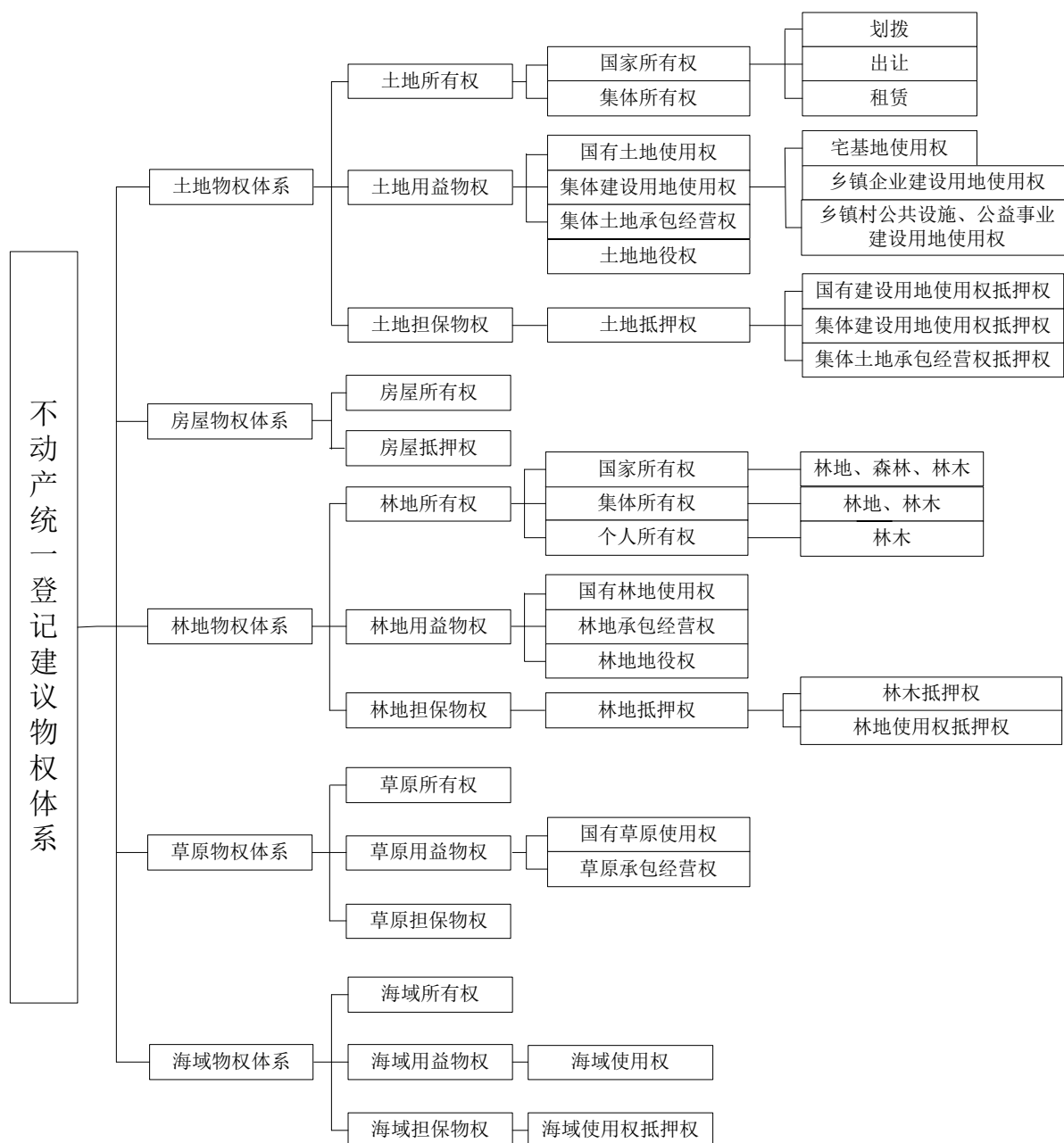
Figure 3. Proposed system for the unified registration of real estate