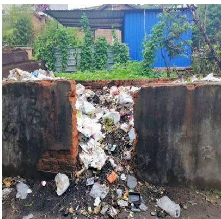
Figure 15. Exposed and discarded garbage 图 15. 垃圾裸露丢弃

大石碑村目前已经实现通水、通电、通路，由于距离城市非常近，可以共享城市基础设施，村民出行、购物、就医、上学都相对便利，但是村内与村民日常生活息息相关的基础设施却不够完善。首先，村内环卫设施缺乏，现有的公共厕所较简陋，也没有专人定期打扫整理；公共垃圾投放点、处理点不规范，垃圾裸露丢弃，影响局部空气质量，破坏村内村容村貌(详见图 15)。其次，村内缺乏完备的污水处理系统，雨水、各种生活污水、动物排泄物主要采用明沟散排的方式排放(详见图 16)。再次，村内的公共空间狭小，几乎没有供村民茶余饭后闲聊、休憩的公共场所，如公房、广场等，也缺少供村民健身活动的设施。此外，村内电力线路采用架空敷设的方式，布局较为凌乱(详见图 17)，供配电可靠性、安全性差，现有一台变压器无法满足高峰期用电需求。