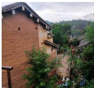
Figure 9. Civil architecture 1 图 9. 土木结构建筑 1