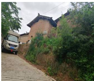
Figure 7. Vehicle parked on the roadside 1 图 7. 车辆路边停放 1