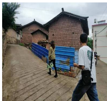
Figure 4. Cement pavement 2 in the village