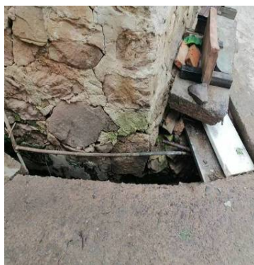
Figure 16. Open ditch scattered sewage discharge 图 16. 明沟散排污水