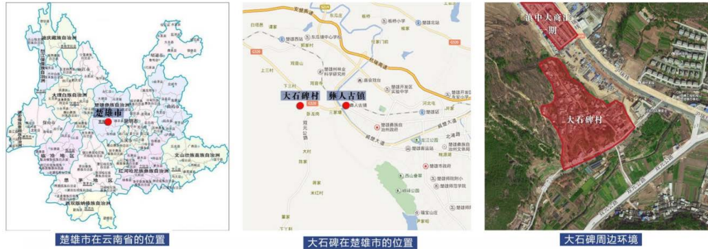
Figure 1. Location map of dashibei village 图 1. 大石碑村区位位置图

约 3 km。地处东经 101°50'、北纬 25°05'，东临 320 国道，南临大白线、河前河、元双公路，北依滇中大商汇，同时紧邻紫溪山森林公园、紫溪彝村。市区 1 路、17 路公交车线路临村而过，地理区位优势，对外交通便利(详见图 1)。