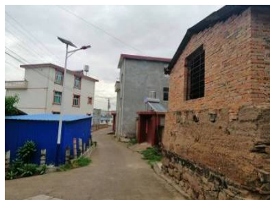
Figure 11. Mixed brick concrete building and privately building in the village 图 11. 村内混杂砖混、搭建建筑