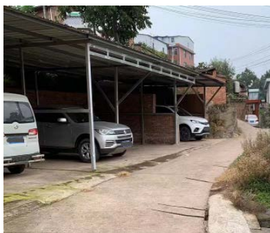
Figure 6. Private carport in the village 图 6. 村内私搭车棚