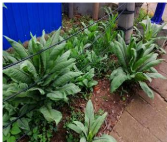
Figure 13. Planting vegetables in open spaces 图 13. 空地种蔬菜