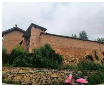
Figure 8. Vehicle parked on the roadside 2 图 8. 车辆路边停放 2