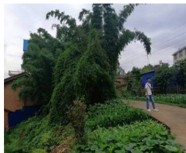
Figure 12. Planting bamboo in open spaces 图 12. 空地种竹子