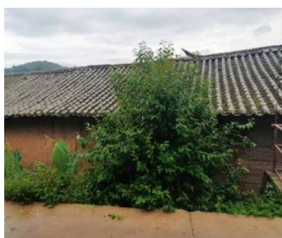
Figure 10. Civil architecture 2 图 10. 土木结构建筑 2