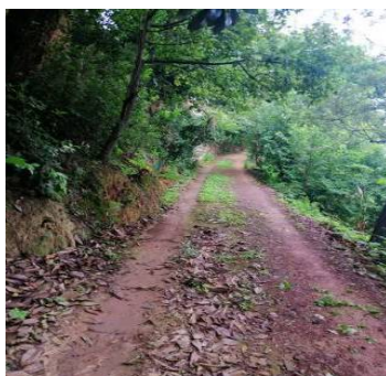
Figure 5. Mud road surface in the village