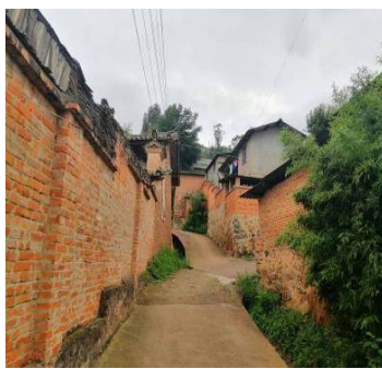
Figure 3. Cement pavement 1 in the village

大石碑村村内主干道及支路均为水泥硬化路面，个别巷道还为原始泥土路面(详见图 3~5)。村内部分道路质量不高，路面坑坑洼洼，存在缺损、破裂等情况。道路普遍较窄且宽窄不一，人车混行，坡度较陡，无防护设施，通行不便。没有集中供车辆停放的场所，不能满足村民停车需求，以致存在私搭建车棚现象，三轮车、摩托车、小汽车常常随意停在路边或房屋旁边(详见图 6~8)。