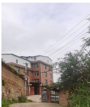
Figure 17. Village power lines 图 17. 村内电力线路