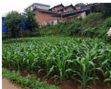
Figure 14. Planting corn in open space 图 14. 空地种玉米