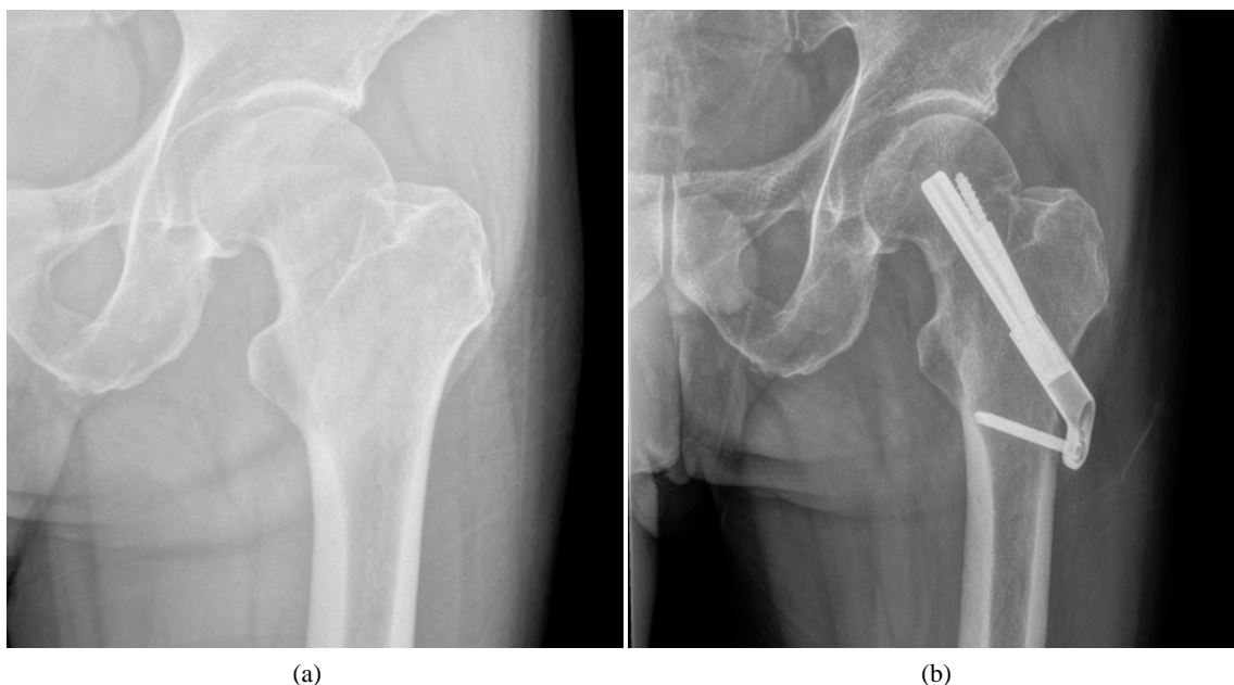
Figure 2. Typical cases of FNS group (a. preoperative pelvis X-ray position, b. postoperative pelvis X-ray position)

图 2. FNS 组典型病例(a、术前骨盆 X 线正位, b、术后骨盆 X 线正位)