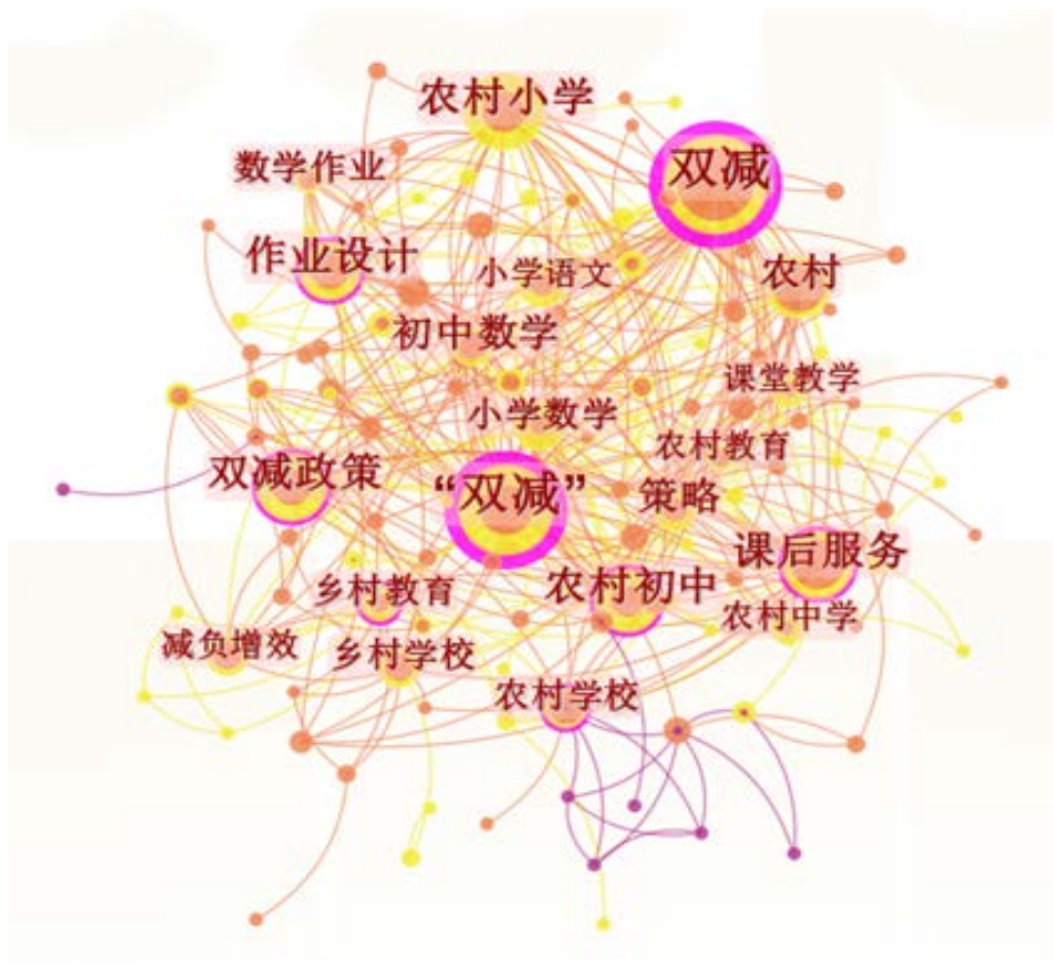
Figure 1. Keyword co-occurrence map 图 1. 关键词共现图

为了对该领域研究的集中趋势有更直观的了解，对高频词进行了统计，见表 1。除了“双减”、“农村”等主题关键词，“课后服务”、“作业设计”的高频次出现说明学者们多从这两方面研究农村地区的“双减”政策。