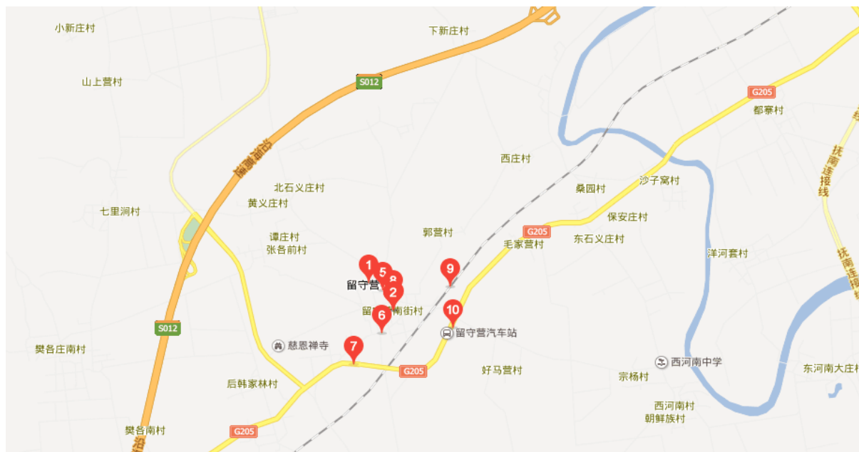
Figure 2. The map of Liushouying town

查阅资料可获取该镇各村庄地理位置信息(见表 1), 经过实地考察, 根据地理、交通和周围环境等因