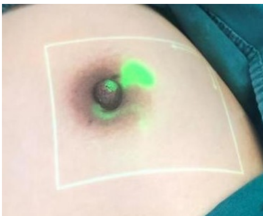
Figure 1. Definitive lesions before skin incision 图 1. 切开皮肤前明确病灶

得了良好的效果[9]。当 ICG 被波长为 785 nm 的激光激发时, 会释放出肉眼无法看到的, 波长为 820 nm 的近红外光。本研究使用的人体淋巴荧光成像仪(江苏信美, 中国)可将 ICG 释放出的 820 nm 波长的近红外光转化为肉眼可见的绿色光, 并原位投射到含有 ICG 的组织, 实现体表的可视化。