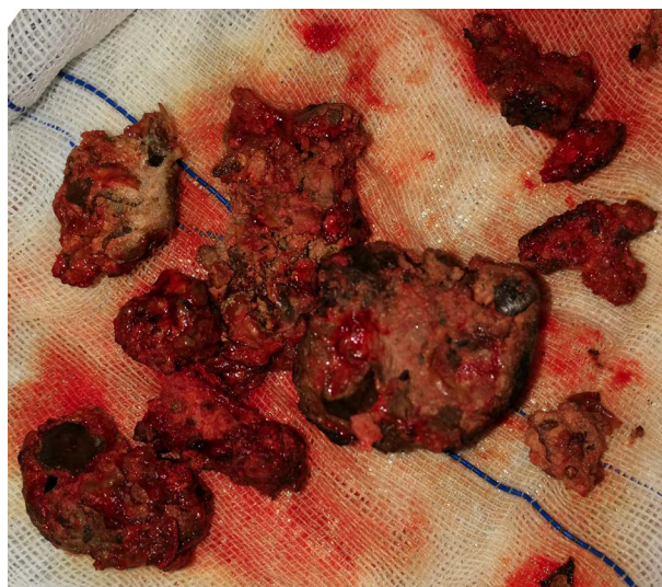
Figure 2. Plant gastrolith was removed during the operation 图 2. 术中取出植物性胃石