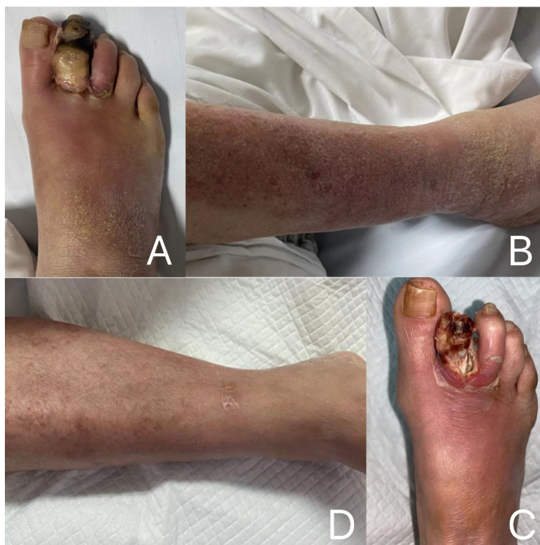
Figure 1. (A) and (B) Basic conditions of diabetes foot patients at admission on September 29, 2021 (The first day of admission); (C), (D) The second day of admission

创面愈合过程见图 1 和图 2。监测体温变化见图 3。入院后予胰岛素泵降糖, 血糖波动于 8~14 mmol/L; 白蛋白补充蛋白质; 阿司匹林肠溶片抗血小板聚集, 阿托伐他汀钙片调脂稳斑。入院第 2 天患足清创见第二趾远端发黑, 近端水肿, 坏死, 予远端坏死趾去除, 并送病理, 可闻及臭味, 双氧水、碘伏、生理盐水反复冲洗, 近端沿第 2 趾中间剪开纵行切口, 未见明显脓液; 完善血培养检查后, 予以亚胺培南 Q6 抗感染治疗, 其体温稍有下降但一直偏高, 下午体温达 39.5℃, 先后予以物理降温、赖氨匹林及地塞米松治疗后体温渐恢复正常范围内。动态复查血常规及血沉指标(表 1)。入院第 3 天复查炎症指标处于上升状态, 但患者最高体温较前下降, 换药见足部创口较前明显好转; 继续亚胺培南抗感染治疗。查右足 X 片(图 4)示: 右足第 2 趾中末节趾骨缺如, 右足第 4、5 近节趾骨、右足第 5 跖骨远端骨质密度减低。此后体温处于正常范围。第 7 天血、尿及粪培养回报阴性; 换药见右足第 2 趾近端残留骨质去除, 未见明显脓液, 少量出血, 调整抗生素亚胺培南 Q12, 监测体温正常。但入院第 10 天下午体温再次升高, 最高体温达 38.8℃, 予以地塞米松治疗后体温趋于正常。之后 13 天内未再出现发热。