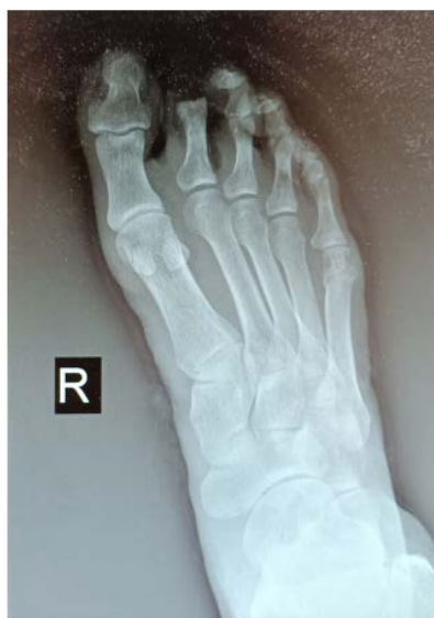
Figure 4. X-ray examination results of the patient's right foot at admission