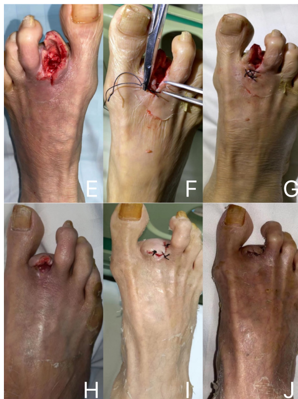
Figure 2. (E) Day 5 of admission; (F) and (G) were admitted on day 10; (H), (I) and (J) were the recovery of affected feet on the 20th, 30th and 40th day of admission

图 2. (E) 入院第 5 天; (F)和(G)入院第 10 天; (H) (I) (J)依次为入院第 20 天、第 30 天及第 40 天患足恢复情况