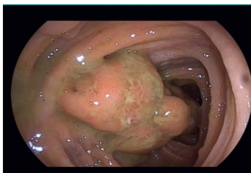
Figure 3. Giant polyp in the ascending colon 图 3. 升结肠巨大息肉