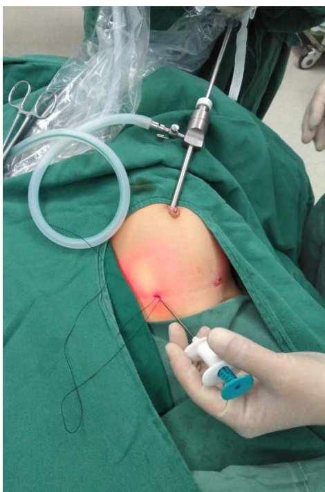
Figure 1. Single-port laparoscopic operation 图 1. 单孔腹腔镜操作

腹，推出器械，Trocar 戳孔处切口缝合，包扎切口。在探查对侧时，若有腹膜皱襞影响探查，可在手术侧针进入腹腔穿破腹膜进入腹腔时，用钩针去牵拉对侧的皱襞，可以准确探查。