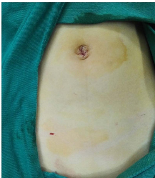
Figure 3. Postoperative incision appearance 图 3. 术后切口外观