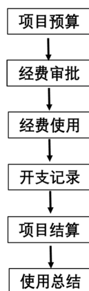
Figure 2. Flow chart of project funds management