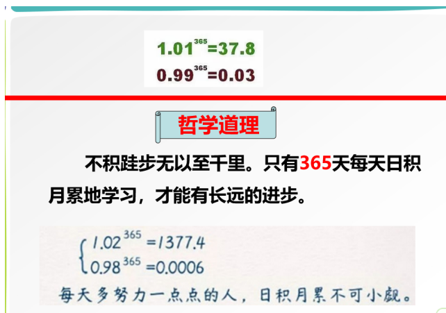
Figure 2. Small probability and big philosophy 图 2. 小概率大哲理

引入，将理论与实际相结合，既能够让学生感受到学习这门课程的实用性，又能够培养学生利用数学知识解决问题的能力。将启发式教学与创新思维相结合，从生活中常被忽视的细节入手，启发学生发现问题、提出问题、分析问题，培养学生的探索、创新精神。例如：可以利用概率统计的知识解决校园内许多涉及隐私的敏感问题；在介绍贝叶斯公式时可以结合家喻户晓的“狼来了”的寓言故事进行分析，由此引导学生铸就诚信品质，争做文明新人[8]；在对“数理统计基本知识”的教学中，当介绍几种常见的抽样分布时，可以引入“数理统计发展史”引导学生求真务实、开拓创新；讲解“小概率事件”时，可