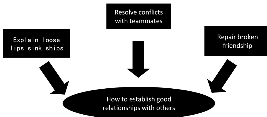
Figure 2. Sentence exercise based on mind map 图 2. 利用思维导图进行句子练习

该环节采用围绕中心意思造句成段的语言练习，该练习可以建立起以功能为中心的目标语言意义关联。也就是说，一个功能表达带动 4~5 个目标词汇的学习和产出，比起单个目标语言促成，语言资源功能化促成更高效(见图 3)。