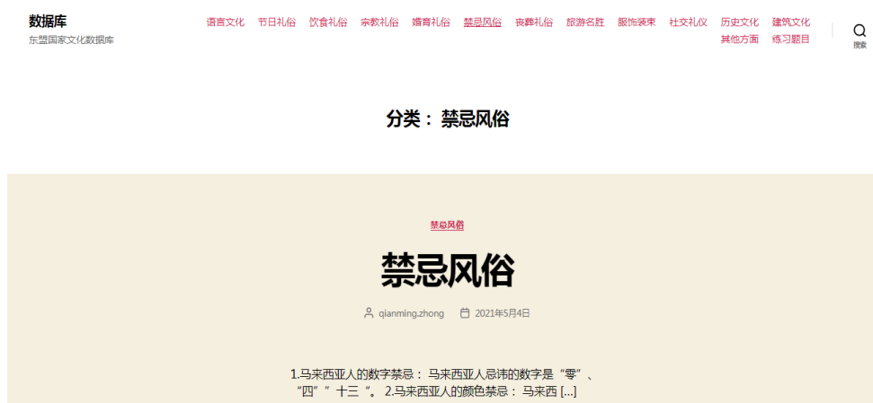
Figure 1. The taboo interface of “ASEAN Culture Database” developed by us

第四是教学过程。我们在课前提前布置学生，结合本课程自主研发可公开访问的“东盟国家文化数据库”提前预习。我们认为对于从事国外汉语教学的人才来说，缺乏实地体验是各高校普遍碰到的难点。为此，我们开发上线了“东盟国家文化数据库”，如图1所示，配合教学实践[5]。