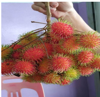
Figure 2. Our on-the-spot photo of Malaysia's rambutan