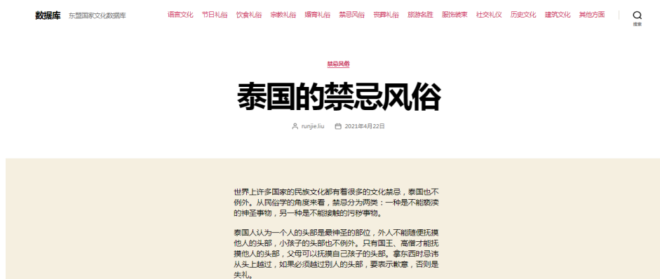
Figure 3. Search and display contents of “ASEAN Culture Database”

“东盟国家文化数据库”检索展开以后，还有东盟各国丰富的文化资源，以泰国为例，并播放相关的音频和视频，界面如图 3：