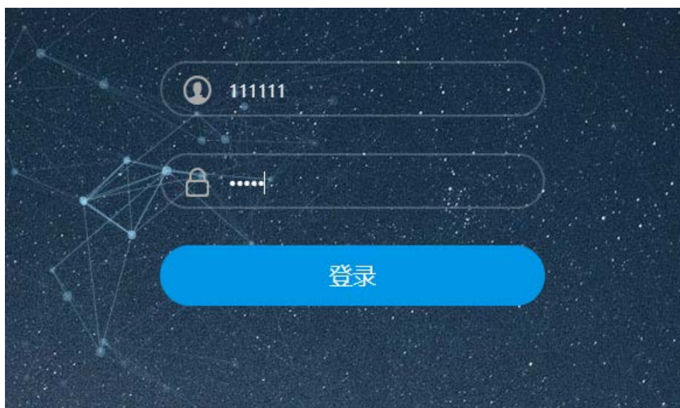
Figure 3. Login page 图 3. 登录页面

作业预警系统通过可以根据学生的学号或者是姓名进行查询，查出该名学生的预测标签的“颜色”，从而可以更加针对性的提出对该名学生的支持服务，如图 3，也可以通过学生姓名或者学号，登录查看某学生的标签情况。如图 4 罗同学形考提交次数为“红色”，班主任可以根据此情况，着重关注该同学的学习情况，提醒该生按时提交形成性考核作业。