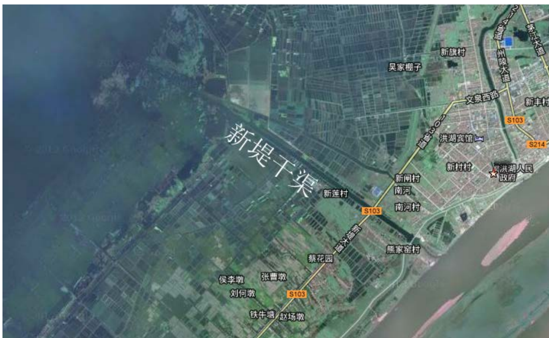
Figure 1. Location map of Xindi Canal

新堤干渠是洪湖及长江的连接渠，为汉南地区利用泛区防洪蓄洪、排涝除渍的重点工程，也是连接洪湖和长江的重要水渠。其地理位置为东经 113°23'0"~113°26'30"，北纬 29°47'40"~29°49'45"，具体见图 1。周边有渔场，建筑公司，砖厂，填料厂等众多中小型产业基地。干渠周围分布众多农田而新堤大闸的直