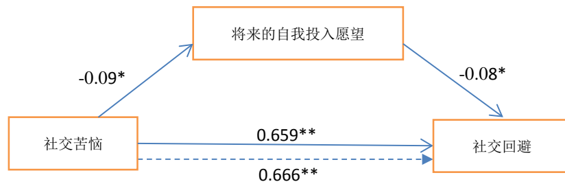
Figure 2. The mediating effect of the future intention 图 2. 将来的自我投入愿望的中介模型

位，也就是在体验中等程度的发展危机之上，现在进行着高水平的自我投入。埃里克森强调虽然个体在整个青少年时期都存在对自我同一性的探索和发展，但是自我同一性形成和发展是持续终生的，其中最为重要的时段是青春期晚期或是成年早期，青少年早期的个体大部分处于都无法达到同一性获得状态，而是处于同一性扩散、延缓或者早闭状态(张日昇, 2000)。对于自我同一性三个维度的多元线性回归分析，结果显示过去的危机和现在的自我投入对将来的自我投入愿望具有正面影响。现在的自我投入水平越高，证明个体正将自我积极投入到所处环境中，不断与外界环境接触，获得各种反馈与信息那么个体对于自己未来计划越久越清晰，越明白自己未来要成为怎样的人；具有较高过去的危机水平的个体意味着在过往中个体面对过较大的矛盾和问题，无形中这些经验使得个体对自己未来的规划越清晰。