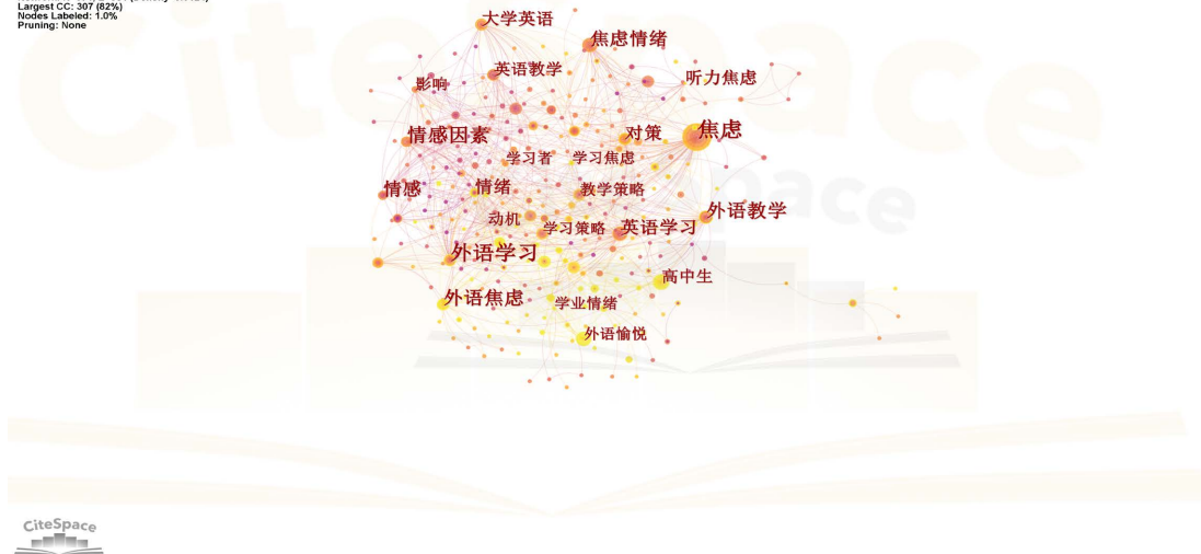
Figure 2. Keyword co-occurrence map of foreign language emotions in China 图 2. 国内外语情绪关键词共现图谱

CiteSpace, v. 6.2.R2 (64-bit) Basic May 16, 2023 at 12:34:45 AM CST WoS: F:\Data for CiteSpace\emotion\data Timespan: 2002-2022 (Slice Length=1) Selection Criteria: g-index (k=25), LRF=3.0, LN=10, LBY=5, e=1.0 Network: N=371, E=851 (Density=0.0124) Largest CC: 307 (82%) Nodes Labeled: 1.0% (82%) Pruning: None