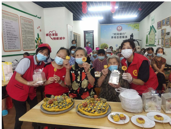
Figure 3. Community workers spend birthdays with the elderly 图 3. 社区工作人员与老人共度生日

然而“爱心午餐”在 2023 年 2 月，由于服务人群的减少、社会组织独自承担成本的不堪重负等因素，戛然而止。东台社区“时间银行”互助养老志愿服务的探索还在继续，但初步试点工作和“爱心午餐”的摸索为其指明了前进的方向，建立一个覆盖范围广、持续性强、互助性高的养老志愿服务模式成为东台社区下一步目标。“我们知道雨花支持到现在已经很不容易了，毕竟一直都不收费，所以我就组织我身边的人，每个月给他们送面、米、油那些物料，能出力就出力，不能出力就出钱，我就捐了 50 元，其他像 1 元、5 元，也是尽自己的一份力量。”(受访者 C，徐妈，87 岁，服务对象/志愿者)“我建议社区建一个老年食堂，在文慧路敬老院有个老人食堂，中餐 10 块(三菜一汤)，我当时就交了 100 元，吃了十天，主要是没了爱心午餐，就会在家蒸馒头、煮面条吃。”(受访者 D，谢姐，84 岁，服务对象/志愿者)“爱心午餐就这样结束还是挺可惜的，以徐妈为首的社区老人还专门制作了一个感谢社区的贺卡(如图 4)，但主要还是经费问题，为了控制成本，我们把开始的参与条件从 68 岁及以上空巢、独居、特殊老年人提高到 76 岁及以上，把控得越来越严格，这使得服务对象越来越少，后面雨花觉得我们社区并没有那么贫困，就搬到柳北区办那里，给更需要的老年人服务。”(受访者 B，黄主任，项目负责人)“2022 年 11 月，社区获批经费一万多，今年经费就可以投入使用了，继爱心午餐后，现在时间银行的服务形式还在探索中，项目还在拓展，关爱老年人服务方案还在酝酿，目前活动还不成熟，社区计划引入各类主体，利用、整合像商会、人大各种资源。虽然现在还没有明确的服务方案，但是现在后续项目有了一个发展方向：类似爱心午餐覆盖范围广、持续性强，继续扩大低龄群体，扩展志愿者群体。”(受访者 B，黄主任，项目负责人)