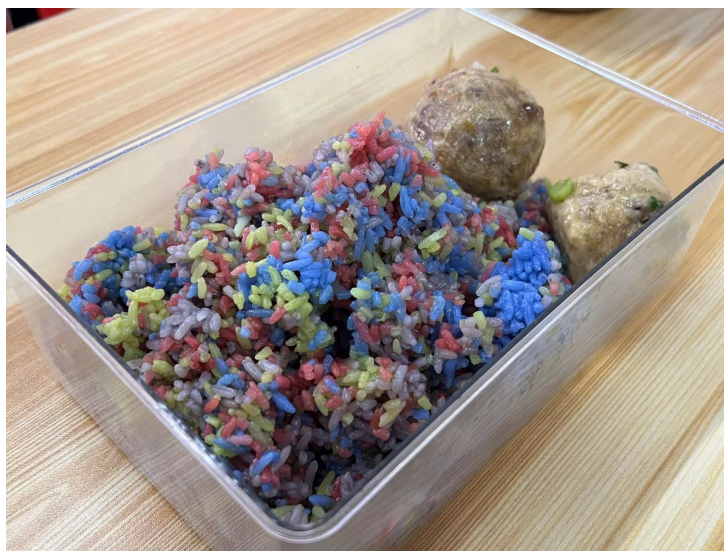
Figure 1. One of the recipes: colored glutinous rice, vegetarian meatballs 图1. 菜谱之一: 彩色糯米、素菜丸子

2021年6月,东台社区与雨花敬老服务中心合作,共同开展“爱心午餐”项目,是继“时间银行”试点工作后,社区因地制宜开展养老志愿服务的进一步探索。“爱心午餐”主要是为68岁及以上空巢、独居、特殊老年人提供免费中午简餐(如图1),菜式主要以贴合老年人偏好为主,相比于上次项目,涉及服务对象群体更多,覆盖范围更广,活动持续时间更久。“当时‘爱心午餐’是先在翠园小区进行试点的,因为翠园小区空巢独居老人、退休老人比较多,开始试点了30户,大概四个月后,社区全面铺开,当时日最高服务人数可达100多人,因为这活动是365天不打烊的,基本上天天都有人来吃。”(受访者 B, 黄主任, 项目负责人)