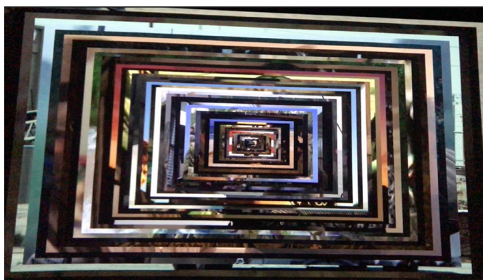
Figure 3. Christian Marclay, <48 War Movies>, 2019, Single channel video installation, the author was photographed in August 2019

英国艺术家克里斯蒂安·马克雷(Christian Marclay)的作品《48部战争电影》(48 War Movies) (2019)通过对声音和图像之间关系的探索(见图3)，对48部好莱坞战争影片进行局部剪辑。在这件影像作品中，人们看到的是一层一层叠置在一起的电影画面，只有在每部影片的边缘才能够模糊观看到战争的景象。作品没有清晰的叙述，有的只是断断续续的、局部一瞥的模糊，嘈杂刺耳的声音和万花筒般不断闪烁的屏幕让人头晕目眩迷失方向。在封闭幽暗的展厅中，48部战争影片叠加的轰炸声、炮弹声震耳欲聋，回旋激烈。艺术家通过对展厅的精心布置，使得所有音效在这里得到极大强化，而物理环境和计算机环境的高度协调也赋予影像以最大程度的真实感和可信感。此时这48部战争影片在观众的视听感知层面上建立的对对应关系尤为真实，而在给观众带来感知真实的同时，也使其产生几近处于战争环境之中的具身性体验。就此而言，似乎这里出现了一些悖论。观看该影像作品的观众绝大部分实际上并没有真正见过或者参与过战争，且参与剪辑的好莱坞影片虽具有其真实的指涉性，但影像实则却是虚构的。然而由于艺术家对于影像和展厅环境极其细致考究的处理，却能够为我们带来高度的真实感。感知真实作为数字虚拟环境和真实物理环境之间的粘合剂，成为数字影像区别于照相摄影而独特存在的基础。尽管在我们将其称作“真实的”时还涉及关于本体论等问题的讨论，但由于它们所携带的感知信息是有效的，仍然能够获得一定程度的摄影式真实感。而正是这种摄影式真实感，为其宣扬关于战争的反思和引起观众的共鸣提供了基础并产生出极大的催化作用。这部影片没有开始，也没有结束，它寓意着从美国内战到近时的伊拉克战争，尽管这样动荡的局面也许会一直持续，但绝不会重复。