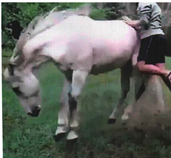
Figure 1. Arthur Jafa, <The White Album>, 2019, Single channel video projection, excerpt from Biennale Arte 2019 Short Guide 图 1. 阿瑟·贾法，《白色唱片》，2019，单频道影像装置，节选自 2019 威尼斯双年展展览手册

体同伴的冒险之旅。在这件影像作品中，艺术家透过一种与观众理解和感知相符的形式表现出观众所熟悉的、现象世界中的光线、色彩、形象和运动等，在观众的视听经验和动画影像之间建构起一种结构性的关联，以此使得观众即使在观看虚拟影像时，也能够获得高度的感知真实体验。例如，影片将熟悉的叙事轨迹与奇异的怪物体结合，生成令观者感到不安却又可识别的奇异角色，创造出一种似乎是现实主义却又饱含非现实主义特质和元素的景象，令人不禁误感这个梦幻般的空间似乎就真实存在于宇宙的某一处。而展厅中为配合影片特意定制的振动座椅，更是为这个幻觉世界增添了一个真实的物理维度。在当前这个已然步入后现代主义的时期，乔恩·拉夫曼以一种反乌托邦的超现实手法来探索人们关于未来观念的转变，并试图打破人们对现象世界中机器和科技高速发展仍然保留的乌托邦幻想。透过对于这种诡异未来空间的观看和真实体验，使观者开始对原本自身所处的这个真实物理空间开始有所质疑和反思。