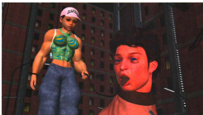
Figure 2. Jon Rafman, <Dream Journal>, 2018~2019, Single channel HD video, excerpt from Biennale Arte 2019 Short Guide 图 2. 乔恩·拉夫曼，《梦想杂志》，2018~2019，单频道 HD 影像，节选自 2019 威尼斯双年展展览手册

实际上，当代著名电影理论家斯蒂芬·普林斯(Stephen Prince)在其研究中指出，现已有理论家认为，尽管观众在对电影进行观看时对指向性具有强烈的需求，但这种需求却是在认定现实主义的基础上，重视与其同时发生作用的其他元素之间积极的相互作用下产生并进行的。而这里所言之“其他元素”，被认为葆有某些非现实主义的的特质，或是反现实主义意识形态的表现，这为观众能够理解和接受科幻电