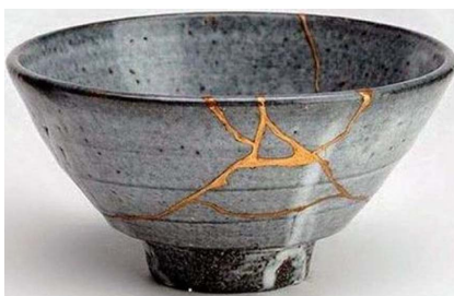
Figure 2. The utensil after “Kintsukuroi”