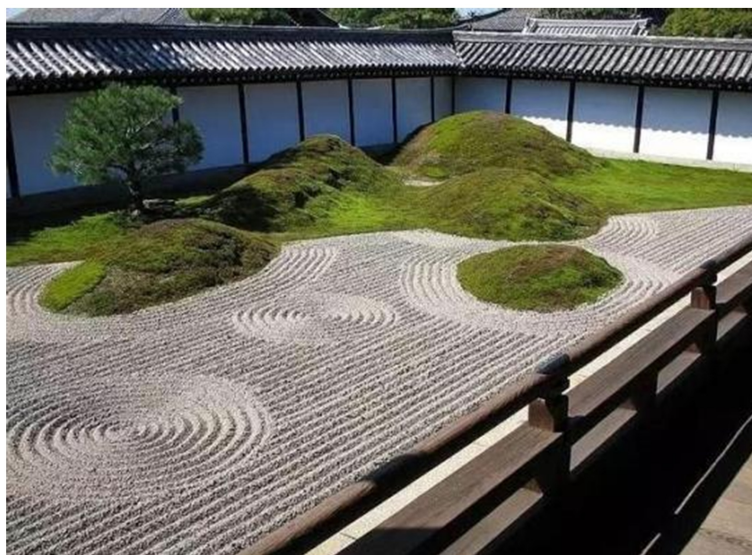
Figure 3. “Japanese rock garden” landscape

另外, 在环境和室内设计中, 侘寂通常用竹子、原木、石头等大自然中没有任何加工的原材料去装饰空间, 甚至可以将树移至房内, 把整个室内空间与自然融为一体, 不仅不突兀, 反而更显自然韵味。例如日本最具代表性的园林景观“枯山水”(如图 3), 这种造园艺术起源于中国, 在传入日本后, 融入了日本人生存忧患的意识, 在日本的禅宗寺院中最为常见[4]。其在庭园内的造景用岩石表现瀑布、以白沙等表现溪流, 因其没有真正的山水而得名“枯山水”, 这些天然的沙石与植物相结合, 产生了一种独特的韵味, 像是将自然世界搬至了庭院, 充分体现了侘寂中回归自然、表现自然的朴素淡雅之美, 其将日式庭院设计推至了更高的层次, 令观者在其中能够产生精神上的感悟与思考。