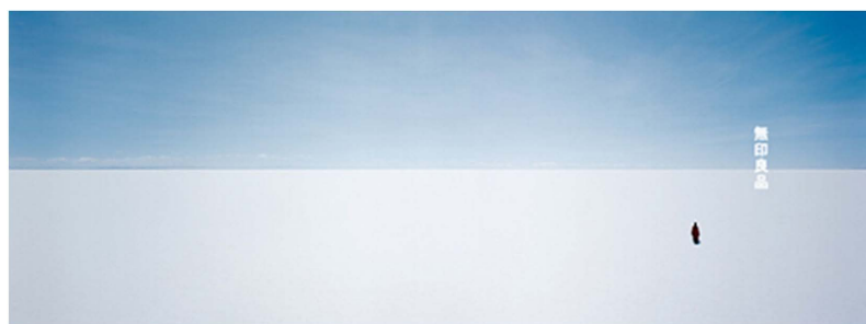
Figure 4. One of Muji's "Horizon" poster series (source: https://image.baidu.com/ )

无印良品从产品设计到店面布置整体皆充斥着简洁朴素的特性, 在其产品设计中体现着简约淡雅和自然的意蕴, 并且在选材上讲求可持续性和环保性。不仅是产品设计, 无印良品的海报设计中同样体现了侘寂之美。无印良品的“地平线”系列海报设计整体干净、自然和纯粹(如图4), 画面中利用空旷的自然风景和大量的留白处理, 完美的体现出了空寂之感。不仅使观察者产生自由联想的空间, 同时也烘托出了画面的主题, 充分表现了无印良品的品牌文化。