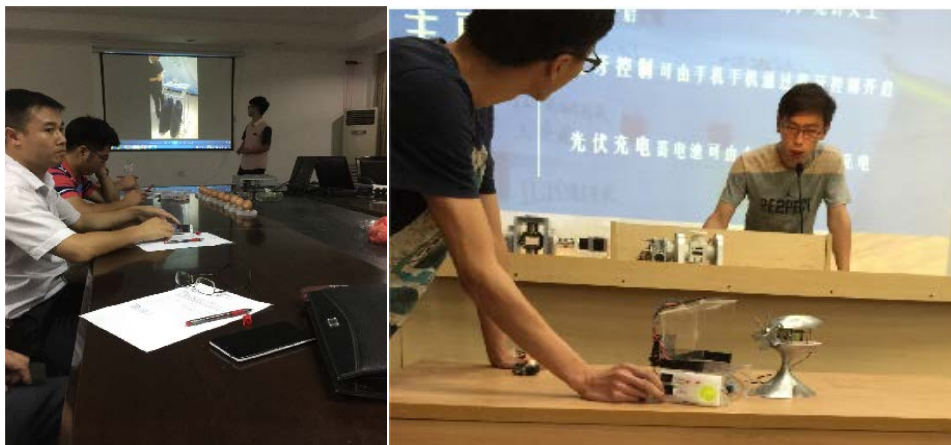
Figure 3. Enterprise engineers teach and guide college students' entrepreneurship training 图 3. 企业工程师授课引导大学生创业培训