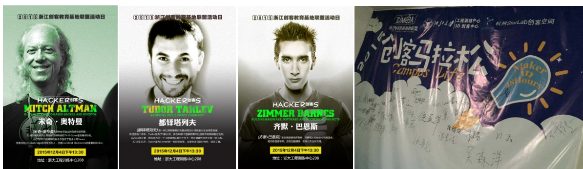
Figure 4. Maker instructor hires and Maker activities 图 4. 创客导师聘请及创客活动开展