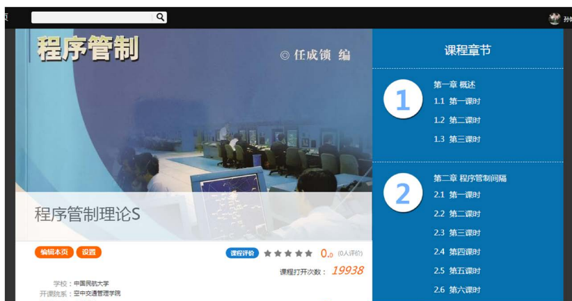
Figure 3. The course group relies on the online course resources created by the Chaoxing platform 图 3. 课程组依托超星平台打造的线上课程资源