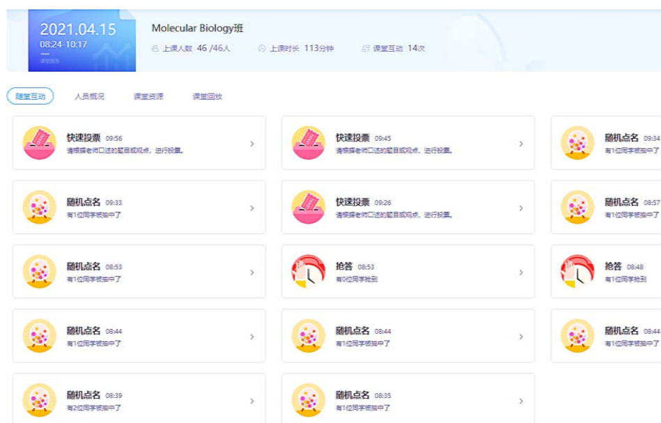
Figure 2. The interaction in the online and offline mixed class of molecular biology

输出式学习法, 学生是课程的主角, 课堂互动很多: 例如课堂读译、核心词汇辨认、随机小考、课堂讨论等, 这些教学环节会占用大量的课堂时间(见图 2, 单次课堂互动达 14 次), 因此, 一定要采取线上线下混合式教学, 将课程 PPT 上传至网上, 或者制作微课等, 将基本概念和理论的学习转移至线上, 布置学习任务和目标, 由学生自主完成。课堂时间主要用于重难点的讲解、研讨, 并让学生输出, 考察学生线上自主学习的结果。学生线上自主学习结果考察方式为写学习汇报, 每个单次线上学习的学习汇报包括: 列举本节概念、知识点、遇到的问题。