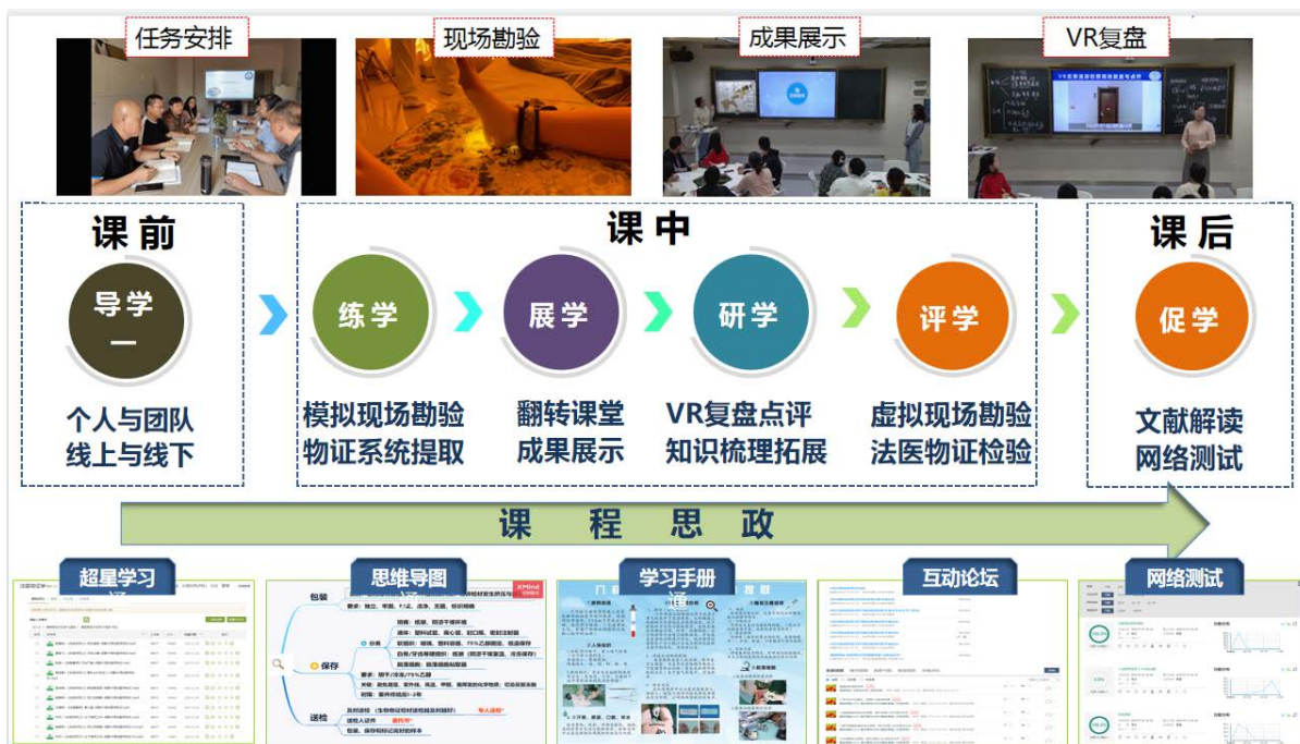
Figure 1. Teaching practice case diagram