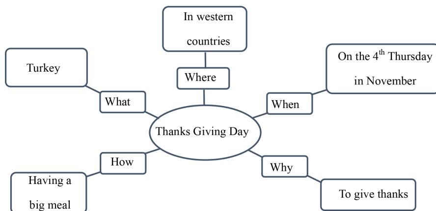
Figure 2. Discourse knowledge structure 图 2. 语篇知识结构图