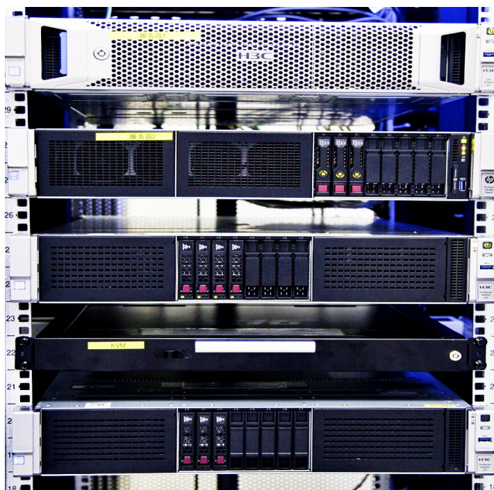
Figure 1. Rack server 图 1. 机架式服务器