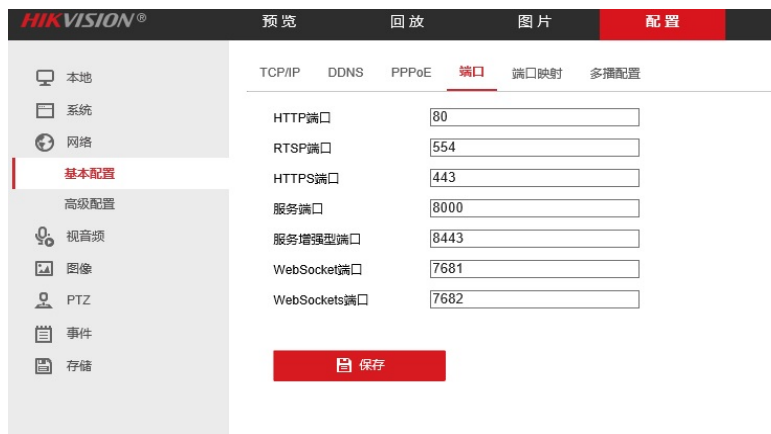
Figure 3. Default ports for Hikvision front end cameras 图 3. 海康前端摄像头默认端口