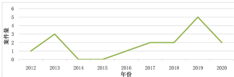
Figure 2. The total number of cases that require criminal responsibility 图 2. 需要承担刑事责任的案件总量

从以上数据可知，由于我国仲裁业的蓬勃发展，自 2013 年“枉法仲裁罪”出现以后，我国法院开始受理当事人提起的枉法仲裁案件，加强对仲裁员的监督，尤其从 2016 年至今，我国法院裁判的枉法仲裁案件出现质的发展。 2