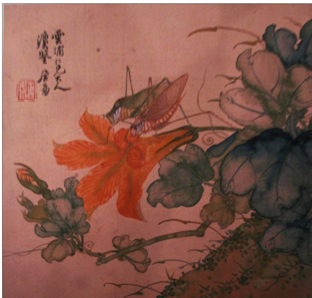
Figure 4. "Grasshopper pumpkin flower" painted on the DouFang by Juchao 图 4. 居巢《草蜢南瓜花》斗方