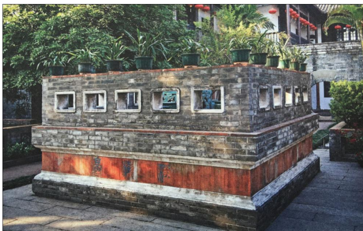
Figure 1. The Zishu Platform in Dongguan Keyuan Garden (The flowers of the four seasons are Cymbidium goeringii , Cymbidium faberi , Cymbidium ensifolium , Cymbidium sinense )

梁园中名气最大的是无总懈斋、寒香馆、十二石斋和汾江草庐, 园主人梁氏叔侄四人都是当地知名