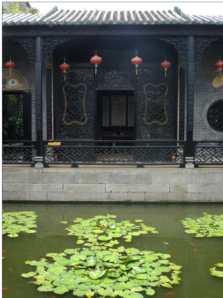
Figure 2. Lotus Square Pond of the Linchi Villa in Yuyin Garden 图2. 番禺余荫山房临池别馆的四方荷池

故称临池别馆。同时, 古时候的文人雅士以墨砚为“池”, 蘸砚挥毫成为“临池”, 以临池来命名体现了园林植物配置景观与书画创作活动的息息相关(图2)。