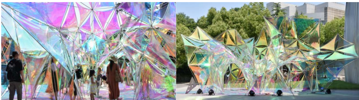
Figure 5. Nanjing university of the Arts-Flora pavilion

花之亭位于江苏省南京艺术学院,设计理念源自“芙洛拉(FLORA)之花”(图5所示)。设计团队将“花”重新演绎,形成诗意的建构,造型极具视觉张力与表现力。设计团队将光与影的运用发挥到极致,在光的作用下,通过材料与表皮的折射或反射形成了梦幻效果,使整个亭子静中有动、动中有静,或宁静平缓或紧张急促,带给观者以情绪上的升华,成为了标识性的校园艺术空间。