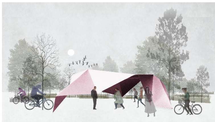
Figure 3. Leisure pavilion design scheme 图3. 休闲凉亭设计方案 3