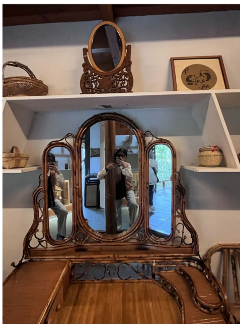
Figure 3. Bamboo dressing table Bamboo products into modern life 图3. 竹制梳妆台竹产品融入现代生活 ③

中国明代思想家王艮曾经提出“百姓日用为道”, 将设计融入人们日常生活需要, 配合当代审美和使用功能, 能提高产品的溢价价值, 符合现代设计需求(见图3)。