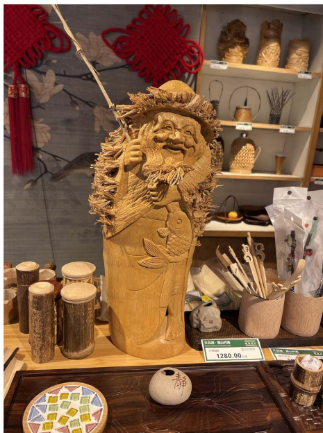
Figure 2. The bamboo carving craft is easily damaged 图 2. 竹雕工艺品相易受损®

但目前竹编竹雕等工艺品由于材料的不易反复拆解, 部分连接强度不高, 不利于拆解和运输, 其功能相对单一造型主要以框架结构单体的形式出现(见图 2), 这些主要原因是造成竹工艺品在市场竞争中逐渐边缘化。