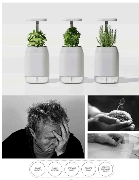
Figure 3. Plant. t Plant growth device 图 3. Plant. t 植物生长装置 ®