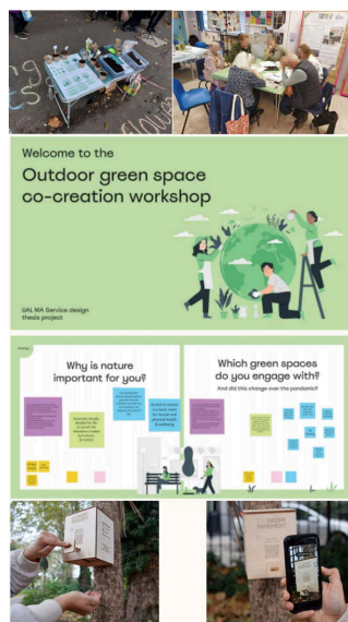
Figure 5. UAL The Green Pavement works 图 5. UAL 《The Green Pavement》作品 ⑤

The Green Pavement 是一项公共参与服务，旨在促进当地社区的绿色空间。见图 5 所示，是伦敦艺术大学(UAL)的 BA service design 专业的作品，创作者是 Fianda van Kuler，该服务通过社区行动支持绿色倡议，鼓励居民开始在现有绿地种植，促进居民关系，并共同为社区做出贡献。这种体验形成了对社区业主的归属感。活动形式内容多样，包括旧物置换、苹果采摘、园艺绿色市集、社区园艺食堂、户外绿色共创工作坊，并在社区内建立种子炸弹模拟机。组织老人们在农场进行农作物采摘，采摘的水果等可作为食材炸成苹果汁或是制成苹果派，在社区内园艺绿色市集内售卖。提倡居民在社区内种植，产出的植物可作为艺术品进行礼物交换，或是种出瓜果蔬菜在园艺食堂内制成菜肴供他人食用，老人们还可在农场、食堂、市集等场所担当志愿者的角色指引参与者，并定期聚集老人们共同研讨活动形式的接受程度或生活需求来指引下一阶段形式的升级。在社区内建造“种子轰炸机”设施，便于居民在指定区域内种植并记录生长日记，可在线上平台或是现实中和邻居或是世界范围内的参与者交流沟通。通过这一系列的规划流程，老人可以从此类社交活动中受益，也能够更容易地融入社区，并增加与外界接触的机会点。