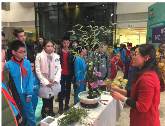
Figure 4. “Good Class for Gardening Life” activity of Beijing World Garden Bureau 图 4. 北京世园局“园艺生活好课堂”活动 ④

The Green Pavement 是一项公共参与服务，旨在促进当地社区的绿色空间。见图 5 所示，是伦敦艺术大学(UAL)的 BA service design 专业的作品，创作者是 Fianda van Kuler，该服务通过社区行动支持绿色倡议，鼓励居民开始在现有绿地种植，促进居民关系，并共同为社区做出贡献。这种体验形成了对社区业主的归属感。活动形式内容多样，包括旧物置换、苹果采摘、园艺绿色市集、社区园艺食堂、户外绿色共创工作坊，并在社区内建立种子炸弹模拟机。组织老人们在农场进行农作物采摘，采摘的水果等可作为食材炸成苹果汁或是制成苹果派，在社区内园艺绿色市集内售卖。提倡居民在社区内种植，产出的植物可作为艺术品进行礼物交换，或是种出瓜果蔬菜在园艺食堂内制成菜肴供他人食用，老人们还可在农场、食堂、市集等场所担当志愿者的角色指引参与者，并定期聚集老人们共同研讨活动形式的接受程度或生活需求来指引下一阶段形式的升级。在社区内建造“种子轰炸机”设施，便于居民在指定区域内种植并记录生长日记，可在线上平台或是现实中和邻居或是世界范围内的参与者交流沟通。通过这一系列的规划流程，老人可以从此类社交活动中受益，也能够更容易地融入社区，并增加与外界接触的机会点。