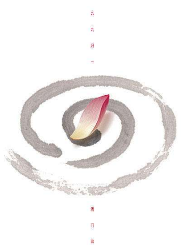
Figure 2. Poster of Macao's return to China 图2. 九九归一·澳门回归海报 ®

靳埭强以澳门行政区区花——莲花为主要元素的《九九归一·澳门回归》图形海报。如图2所示，莲花花瓣与水墨线条构成了图与底的关系，水墨线条回旋形成了花瓣凋零溅起的涟漪，细看会发现是两个数字“9”，99回纹又组成了回家的“回”字，如果把海报上的“九九归一，澳门回归”与“99”回纹结合来看，便形成了中国的“中”字。秉持着对自然规律的遵循，再结合图与底之间的灵动设计，传达出一种花开花谢、叶落归根、生生不息的意境，以及出淤泥而不染的精神本质，画面看似平静无常，却饱含了对于澳门回归祖国的激动之情。借助格式塔完形法则将生命形式与艺术形式巧妙结合，将传统文化与现代设计完美融合。