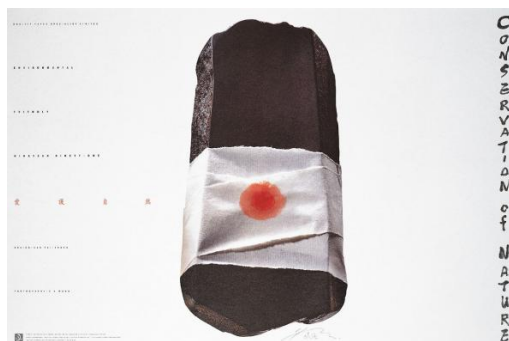
Figure 3. Nature-caring poster

根据异质同构设计的图形海报，能带给我们更深层次的意义。如图3所示，靳埭强为了传达爱护自然而设计的图形海报。海报整体非常极简，一条有红色斑点的白色纱布包裹着平平无奇的岩石，第一眼看上去，就像包扎过的伤口，还在不停地渗出鲜血。但细细琢磨不难发现，这里的石头显然代表了自然环境，而那一道道被扎得严严实实的伤口，则预示着大自然早已被污染所伤，需要我们去呵护它。其实，一块岩石又怎么会流出鲜血，这里是将岩石比作人，它具备了人的血肉，人的情感，它被我们伤害了，需要爱护与保护，物(岩石)与人的同构在此运用。一块岩石、一条纱布、一抹朱砂，分开看都是毫不起眼的存在，但靳埭强通过自己的设计方法将他们完美的结合，这种异质同构能够使观者内心受到最直接的冲击与震撼，让我们不由得反思，不是只有我们人类会受伤，坚固的岩石亦是如此，接着联想到自然，我们赖以生存的地球也会受伤。像靳埭强这一作品中的同构，使人们的共鸣或者说是共情更容易被引发，使环保的主旨思想得到最大程度的传达。