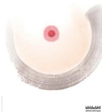
Figure 4. I love mother earth environmental protection poster 图 4. 我爱大地之母环保海报 ④

对于上述作品的分析，能看出在图形设计中闭合原则的运用，就是考验设计师以形达意的过程，借助局限的形来传达出无限的内涵或精神。马克斯·韦特海默说过：“人在知觉的过程中，总是有一种追求事物结构整体性或完形性的特点，这称作知觉的整体性或完形。”而从观者的角度出发，会发现不闭合的形或者是残缺的形，会更刺激观者的感官，带来意想不到的视觉效果。